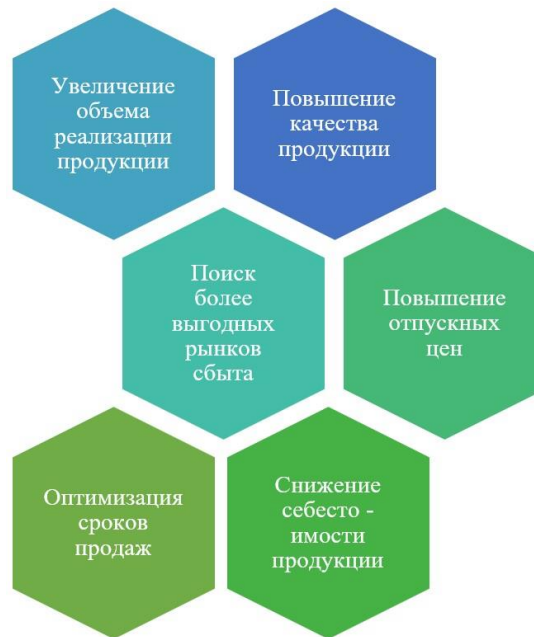
Рис. 3. Рекомендации, направленные на рост прибыли и улучшение финансовых результатов организации

Самым ключевым источником роста прибыли конечно же является увеличение объема реализации продукции, а также снижения ее себестоимости. Очень важно уделить особое внимание факторам, влияющим на снижение себестоимости: