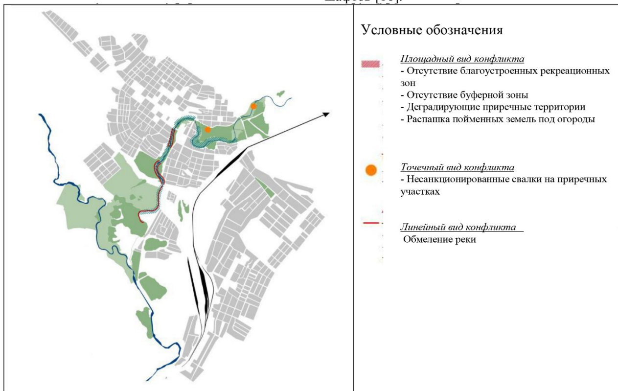
Рис. 4. Схема распространения экологических конфликтов в планировочной структуре г. Валуйки

Достижение поставленных целей возможно на основе ландшафтно-экологического подхода к землеустройству, предполагающего выявление связей в экосистемах и их учет при выборе направлений и видов использования земель, изучение структурно-территориального расположения земельных угодий как природно-хозяйственных систем, их экологического состояния, выявление закономерностей их пространственного развития и учет оптимальной структуры ландшафтов [16].