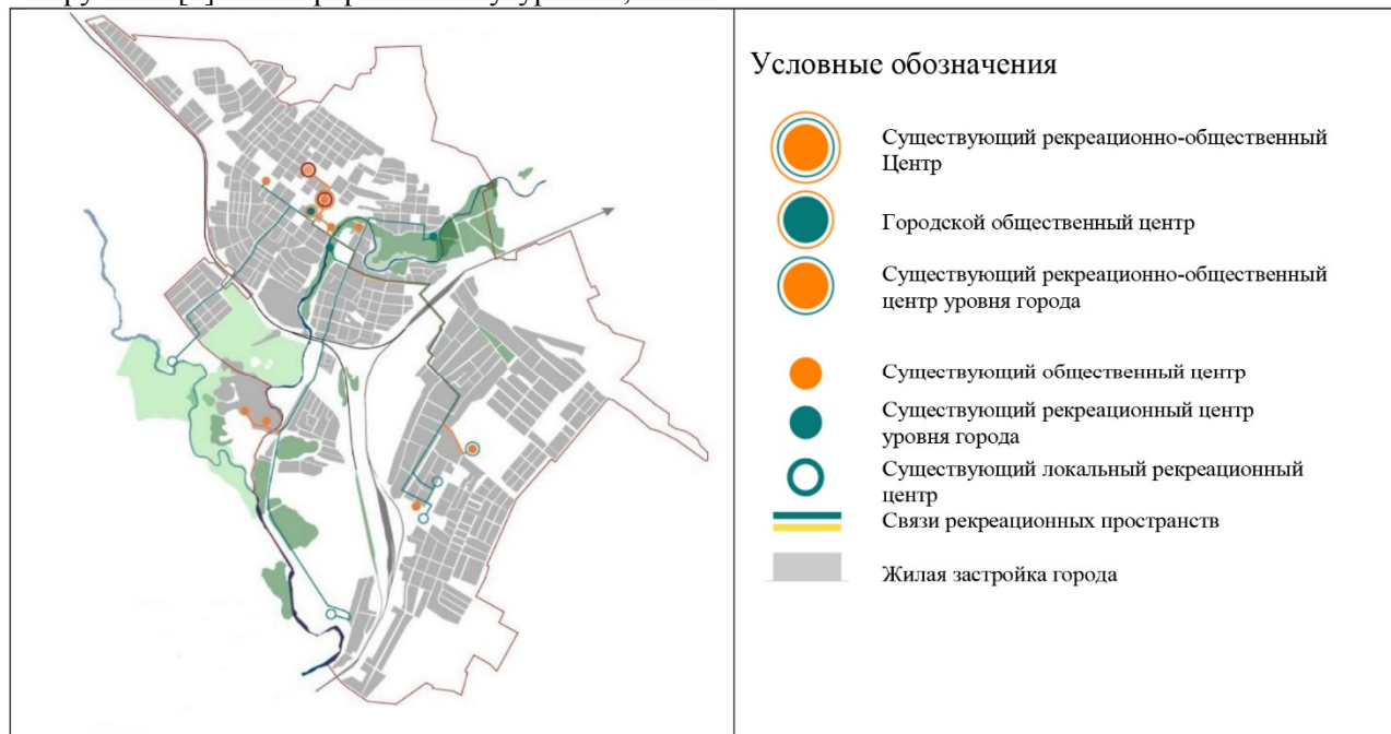
Рис. 2. Современная структура общественных и рекреационных пространств г. Валуйки

продолжительности; по способу возникновения; по характеру проявления; по стратегии развития (урегулирования); по виду локации. В случае, если конфликт имеет землепользовательский или социально-функциональный характер, социальные связи и разрывы непосредственно отражаются в городской планировке.