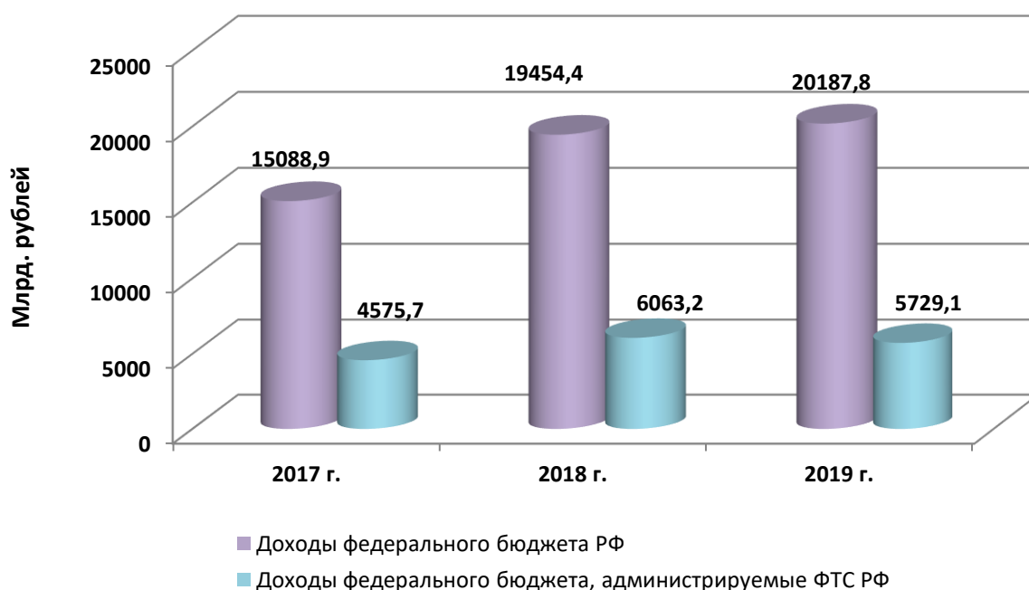
Рис. 1. Статистика доходов федерального бюджета России в 2017–2019 гг., млрд руб.

На рис. 1 проиллюстрирована динамика поступления таможенных платежей в доходную часть федерального бюджета России [15].