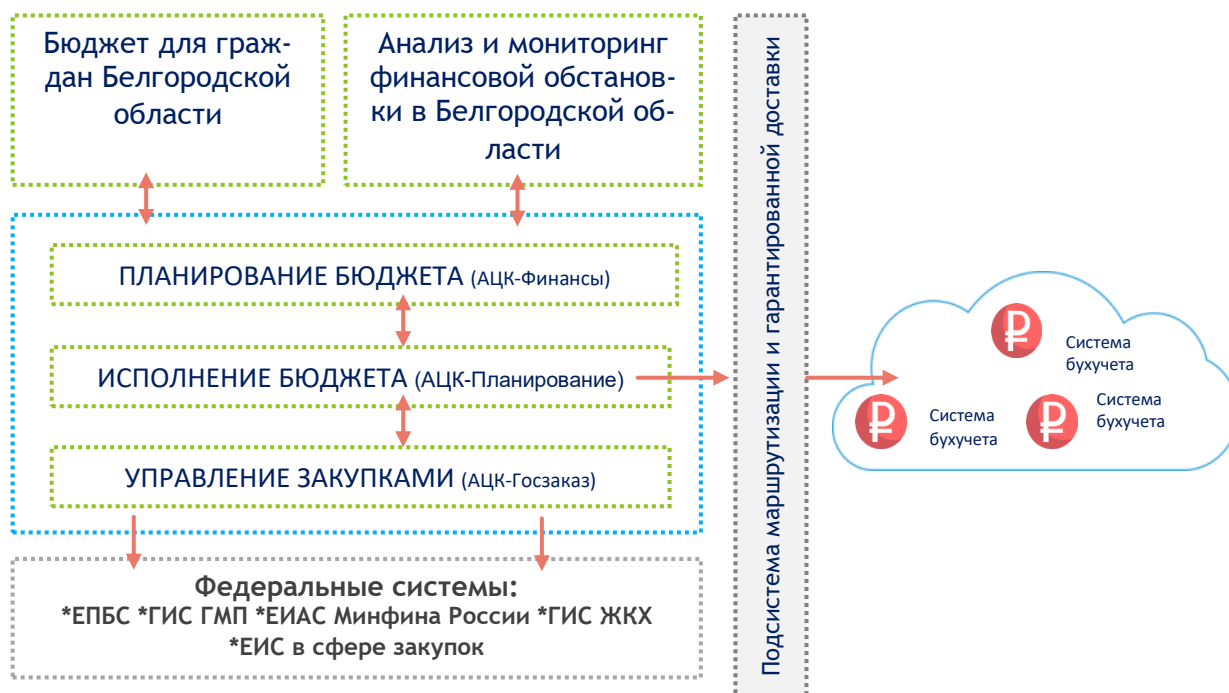
Рис.1. Централизованная информационно-техническая платформа

Комплексная интеграция полностью заработала в Белгородской области с 2015 года, когда была завершена централизация региональной системы управления закупками. В результате сегодня обеспечена централизация финансовых процессов, происходящих как на уровне областного центра, так и в муниципальных образованиях, включая сеть государственных и муниципальных учреждений (рис.1). Благодаря этому в региональном департаменте финансов сосредоточена абсолютно вся первичная, текущая и отчетная финансовая информация. Наряду с этим, повысилась открытость бюджетного процесса, поскольку данные из систем автоматически попадают в федеральные информационные системы и в открытую региональную систему, где гражданам доступна информация о бюджете [1,4].