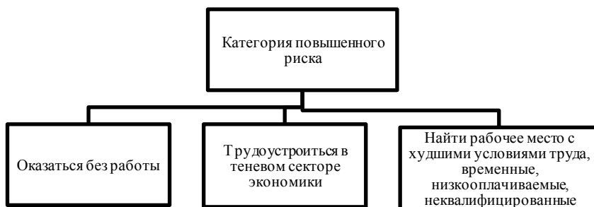
Рис. 1. Молодежь как категория повышенного риска на рынке труда

Исходя из данных официальной статистики, можно сделать вывод о том, что безработица среди молодежи в 2016 году составила 18 %, в 2017 году — 28 %, в 2018 году — 30 %. Приведенная статистика подтверждает то, что структура рынка труда в РФ находится в постоянном изменении. Наиболее востребованными являются вакансии, которые еще несколько лет назад были не особо востребованы. К таким относятся ИТ-специалисты, фрилансеры в разных областях, робототехники, HR-специалисты, рекрутеры и т.д. [1]