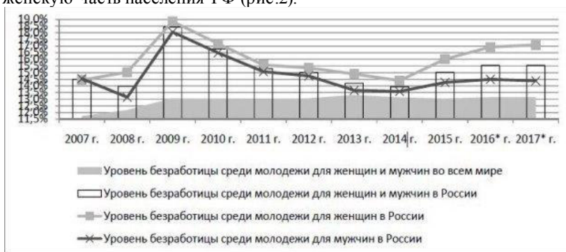
Рис. 2. Динамика уровня безработицы среди молодежи в 2007-2017 гг. [5]

Безработица молодежи распространяется как мужскую, так и на женскую часть населения РФ (рис.2).