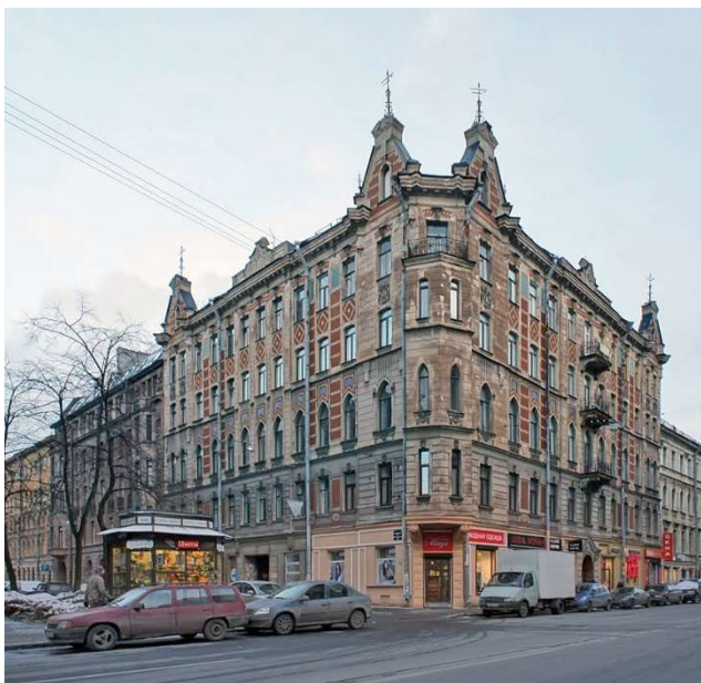
Рис. 3. Фото дома А.П. Романова

Дом А.П. Романова. Санкт-Петербург, Центральный район, Восстания ул., 23; Солдатский пер., 1