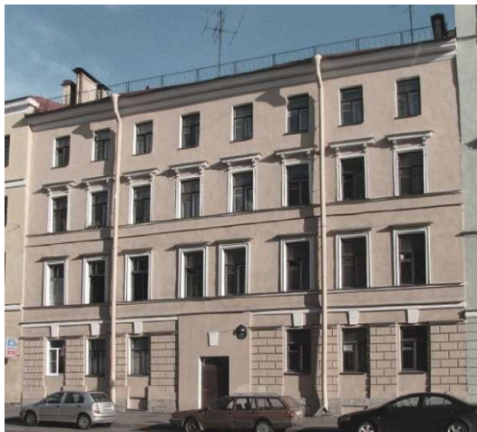
Рис. 4. Фото дома Е.Н. Зуевой (А.В. Михайлов, 2017 год)

Дом Е.Н. Зуевой: Санкт-Петербург, Адмиралтейский район, Садовая ул., 116