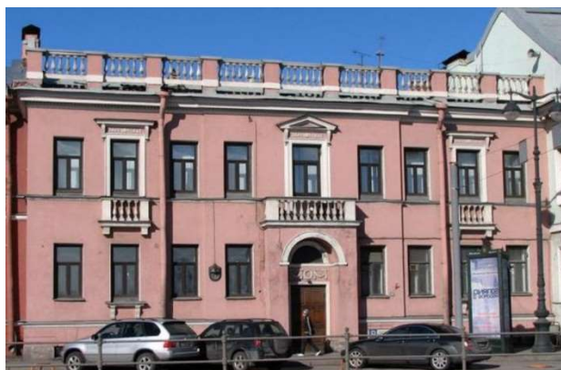
Рис. 1. Фото дома Г.К. Кейзерлинга с Лейтенанта Шмидта наб.

Дом Г. К. Кейзерлинга (М. С. Дружининой) Санкт-Петербург, Василеостровский район, Лейтенанта Шмидта наб., 7; Академический пер. 18 (рис. 1).