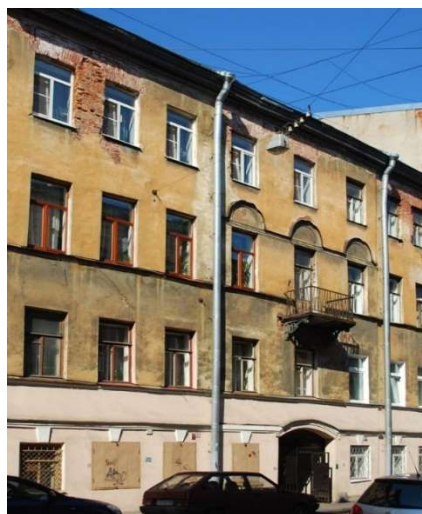
Рис. 6. Фото дома Е.Н. Корево (А.В. Михайлов, 2017 год)

Дом Е.Н. Корево Санкт-Петербург, Адмиралтейский район, Средняя Подъяческая ул., 11.