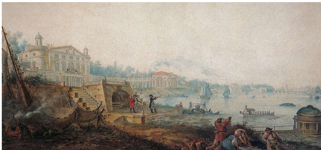
Рис 4. Сергеев А.А. Дача графа И.А. Безбородко. Акварель, 1800 г.

Уже в этот ранний период существования парк в Полуострове был открыт «во всякое время всем порядочно одетым людям» [10]. С конца XVIII в. сад графа Безбородко упоминается в числе мест для публичных прогулок, поскольку он открыт «даже при бываемых у владельцев торжествах», здесь «бывают иногда иллюминации и фейерверки, музыка и пр» (рис. 4) [11].