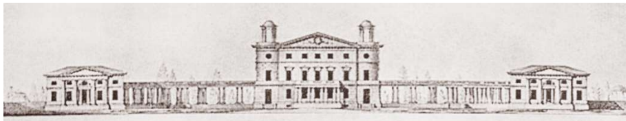
Рис 2. Проект Дачи Безбородко. Дж. Кваренги, 1780-е гг.

Усадьба Г.Н. Теплова насчитывала 1400 десятин. Новый хозяин продолжил традиции казенного сада; в его оранжереях “на пару” круглогодично выращивались клубника, персики, ананасы. После смерти, которого усадьба была продана его сыном канцлеру А.А. Безбородко в 1782 г. [6, 7].