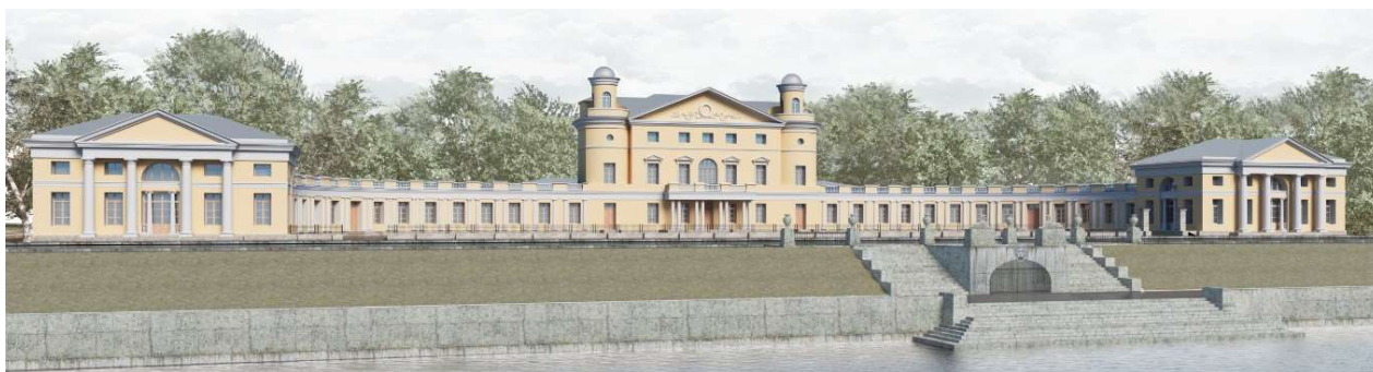
Рис. 5. Вид усадьбы Кушелева-Безбородко со Свердловской наб. (магистр Блинова А.К., СПбГАСУ, 2019)

В советский период в здании дачи размещалась больница им. Либкнехта, туберкулезная больница, затем противотуберкулезный диспансер №5.