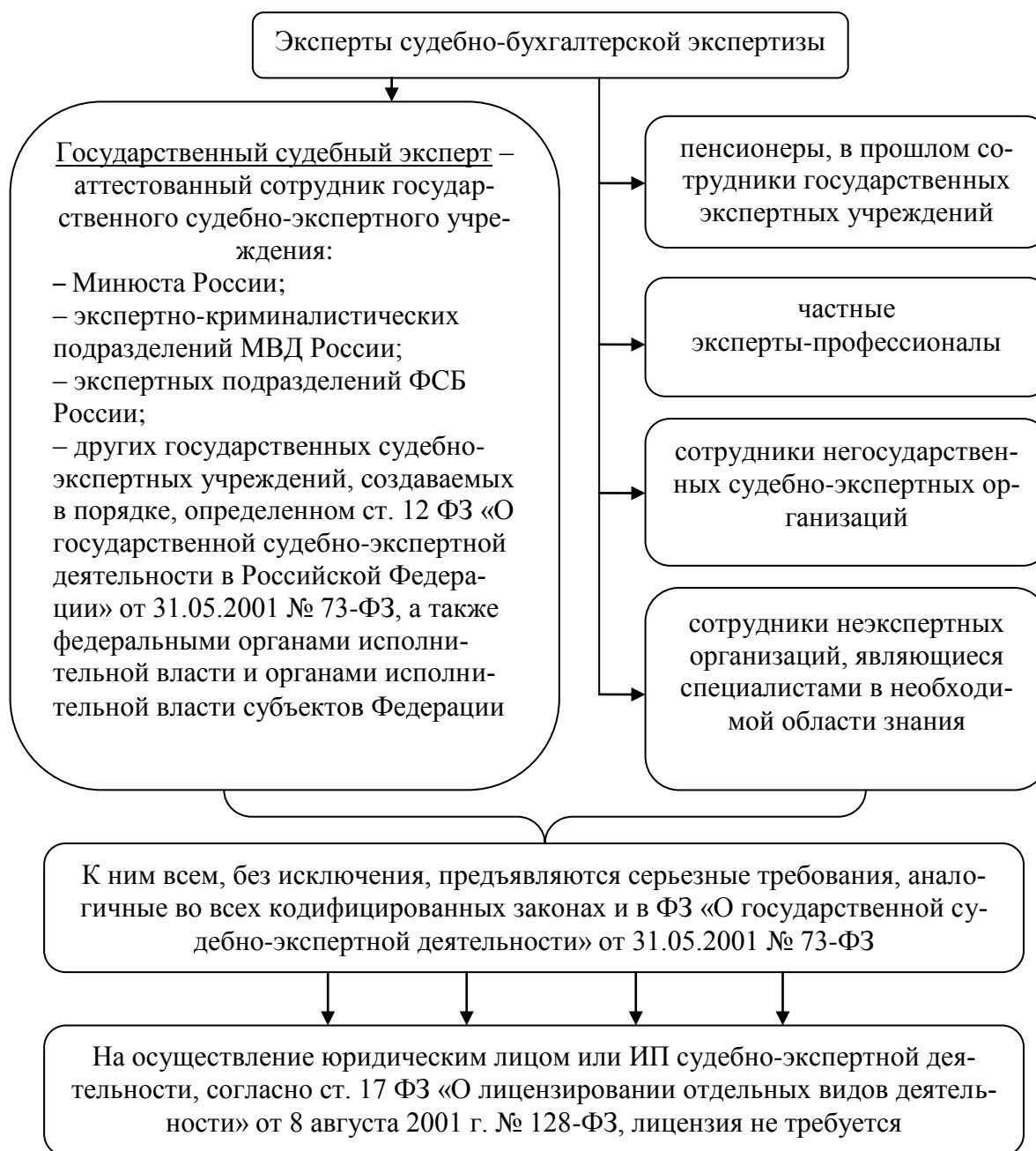
Рис. 1. Эксперты судебно-бухгалтерской экспертизы

Закон наделяет эксперта соответствующими правами, одновременно возлагая на него ряд процессуальных обязанностей (табл. 1).