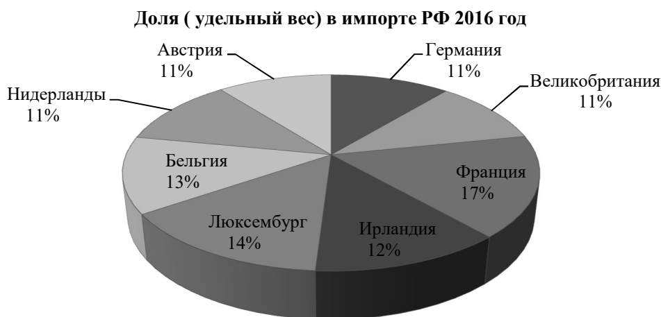
Рис. 6. Доля (удельный вес) в импорте РФ 2016 год

Великобритания (10 %), Нидерланды (8 %), Бельгия (6 %), Австрия (5 %), Ирландия (2 %). Не смотря на то, что доля импорта из Люксембурга очень мала, торговые отношения с этой страной развиваются. Этому свидетельствует стоимостное увеличение импорта в 24,5 %.