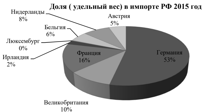
Рис. 5. Доля (удельный вес) в импорте РФ 2015 год

По итогам года импорт тоже снизился. В стоимостном выражении он составил 183,6 млрд долларов, что меньше, чем за прошлый год на 0,3 %.