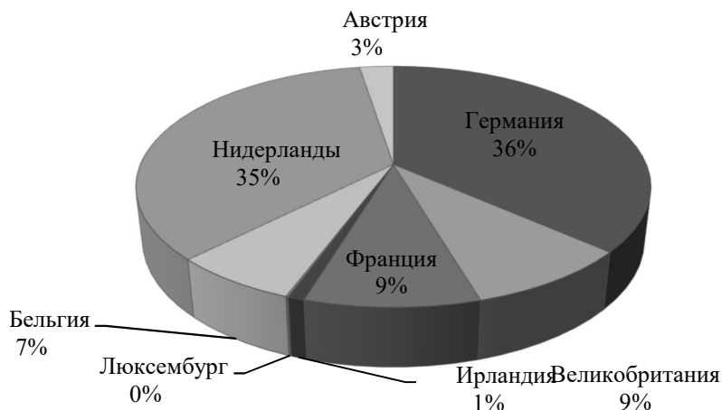
Рис. 1. Внешнеторговый оборот России и стран Западной Европы 2015 год в млн. долл. США

В 2015 году с перевесом лишь в 1% лидером среди стран Западной Европы в более тесных торговых отношениях замечена Германия (36%),