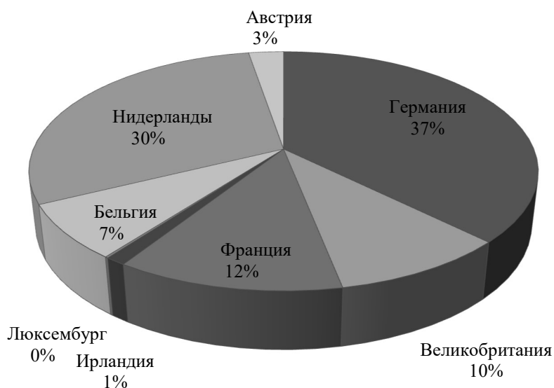
Рис. 2. Внешнеторговый оборот России и стран Западной Европы 2016 год в млн. долл. США

В 2016 году свою лидирующую позицию не уступает Германия, но уже в 37 %. Затем также Нидерланды, но с менее львиной долей, нежели в прошлом году (30 %). Ни смотря на продление санкций Франция увеличила обороты с 9 до 12 %, а Великобритания до 10 %. Неизменно свою нишу занимают: Бельгия, Ирландия и полный аутсайдер – Люксембург.