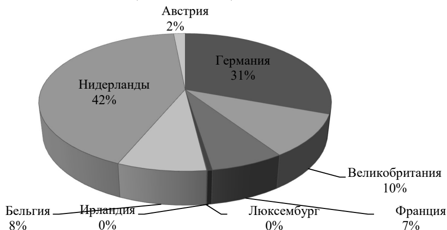
Рис. 4. Доля (удельный вес) в экспорте Российской Федерации 2016 год (млн. долларов США)

По итогам 2016 года экспорт России в стоимостном выражении сократился на 17 % и составил 285,49 млрд. долларов. При этом самые низкие показатели были характерны для января, когда он упал сразу на 37,2 %.