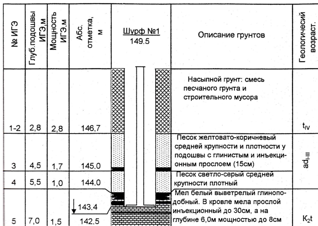
Рис. 2. Инженерно-геологический разрез

нических характеристик грунтов и гидрогеологических условий в период строительства и эксплуатации.