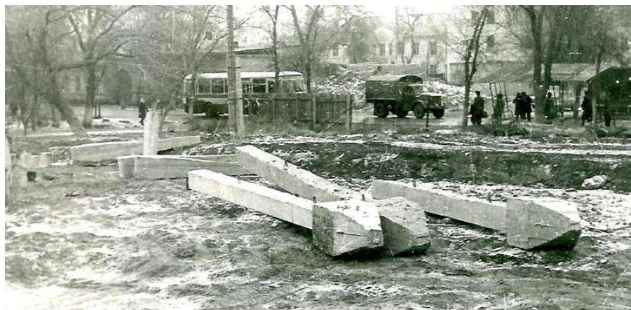
Рис. 5. Булавовидные сваи

Установлено, что дополнительное выштамповывание скважин двумя порциями жёсткого бетона по 0,15 \text{ м}^3 увеличивает площадь опирания свай в забое до 2-х раз, предельное сопротивление свай возрастает с 170 кН до 616 кН, то есть в 3,6 раза.