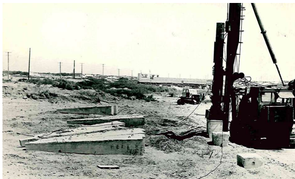
Рис. 1. Забивка пирамидальных свай на тепличном комбинате в г. Курске

Как показала практика строительства, в слабых грунтах при действии вдавливающей нагрузки эффективны конструкции фундаментов в вытрамбованных котлованах . Котлован под каждый отдельный фундамент образуется методом вытрамбовывания на необходимую глубину тяжёлыми трамбовками, имеющими сужение к низу. Затем котлован армируется (при необходимости) и бетонируется. Под основанием фундамента и по его боковой поверхности образуется зона уплотнённого грунта, что повышает несущую способность основания. В результате снижается расход монолитного бетона и опалубочных работ, сокращается объём земляных работ, исключается выполнение ручных работ. Надземные части сооружений можно опирать непосредственно на такие фундаменты, или можно также выполнять в них стаканы под железобетонные колонны.