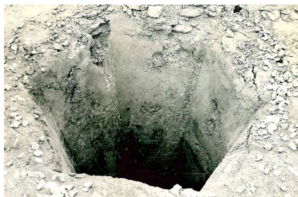
Рис. 3. Вытрамбованный котлован конической трамбовкой под фундамент

Также одним из способов совершенствования фундаментов в слабых грунтах является применение свай, устраиваемых в пробитых (выштампованных) скважинах конической формы. Экспериментальные исследования таких свай осуществлялись на площадке строительства завода химического волокна в г. Кустанае [6].