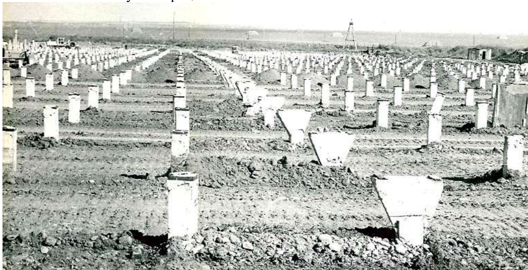
Рис. 6. Свайное поле из булавовидных свай тепличного комбината в г. Кзыл-Орде

Однако булавовидные сваи в слабых грунтах имеют более высокую удельную несущую способность (отнесённую на 1 \text{ м}^3 материала), чем забивные призматические сваи – в среднем 1,5...2,5 раза, что позволяет снизить стоимость возведения свайных фундаментов. Имеющийся опыт показывает, что уширенная часть свай позволяет воспринимать увеличенные нагрузки, а призматическая часть в образовавшейся скважине довольно быстро заливается. Опыт их погружения показал, что забивка в плывуны нерациональна.