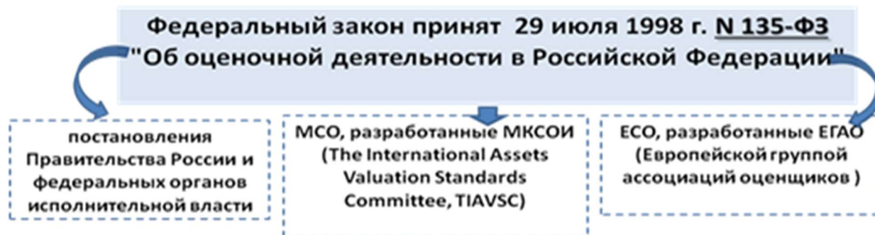
Рис. 1. Нормативно-правовая основа оценочной деятельности

Отметим, что некоторые нормы Закона закреплены на основании положений Международных стандартов оценки, разработанных Международным комитетом по стандартам оценки имущества (МКСОИ, The International Assets Valuation Standards Committee, TIAVSC). Кроме того, Европейской группой ассоциаций оценщиков (ЕГАО) приняты Европейские стандарты оценки (ЕСО) (рис. 1) [3, 4].