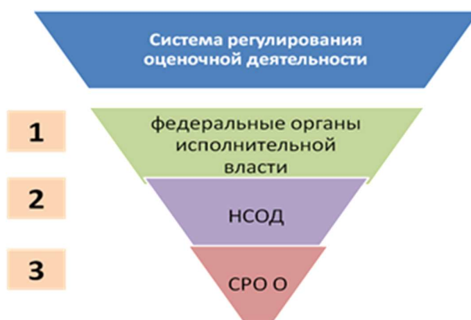
Рис. 3. Регулирование оценочной деятельности

Законом об оценке проведена четкая грань между тремя уровнями системы регулирования оценочной деятельности и строго разграничены полномочия в этой сфере (рис. 3).