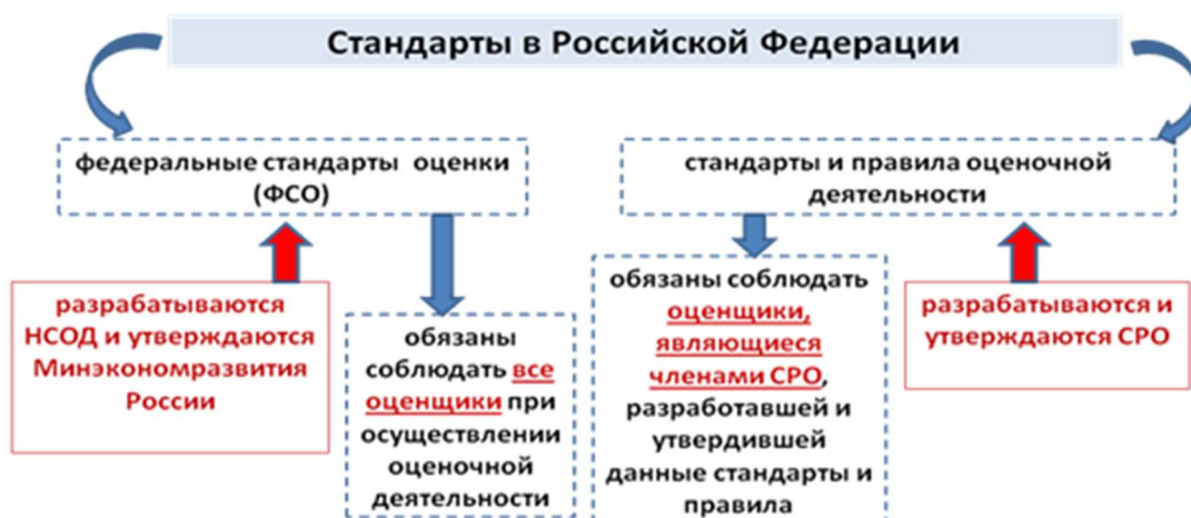
Рис. 2. Стандарты оценочной деятельности

ночной деятельности, разрабатываемые и утверждаемые СРО (рис. 2) [7].