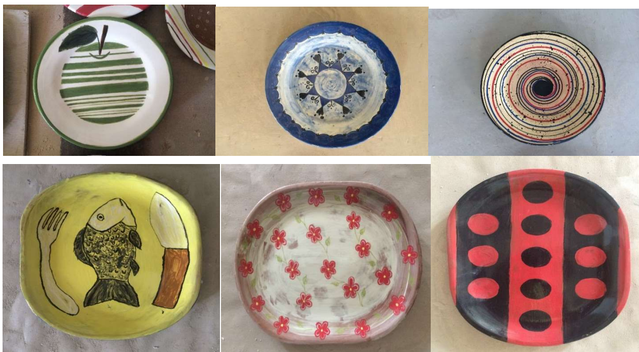
Рис. 5. Ангобная роспись керамической посуды