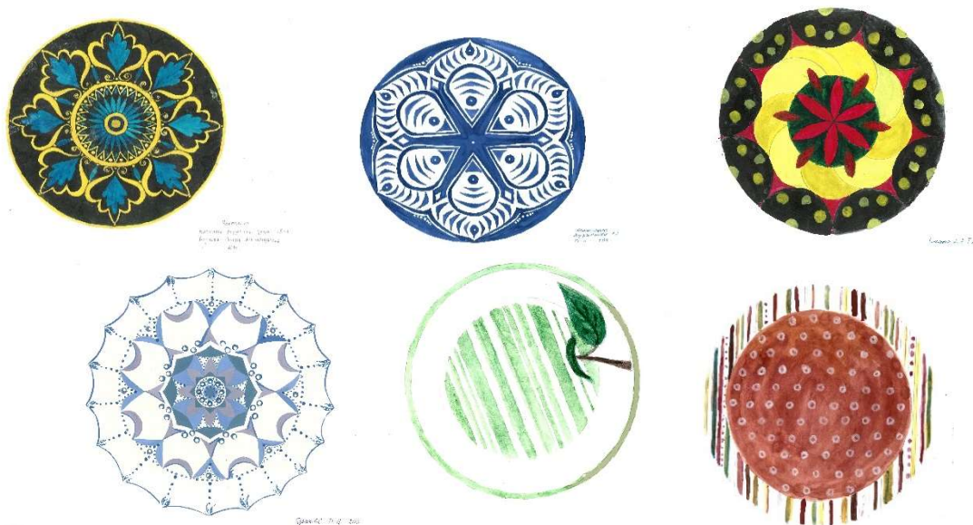
Рис 4. Учебный эскиз росписи керамической тарелки.

«Субъективный характер может проявляться по разному: в пропорциях, в интерпритации форм, в предпочинении, например, контрасту светлого и темного, в линиях, текстурах, колорите и нередко в сочетании всех этих особенностей художественной выразительности вместе» [7].