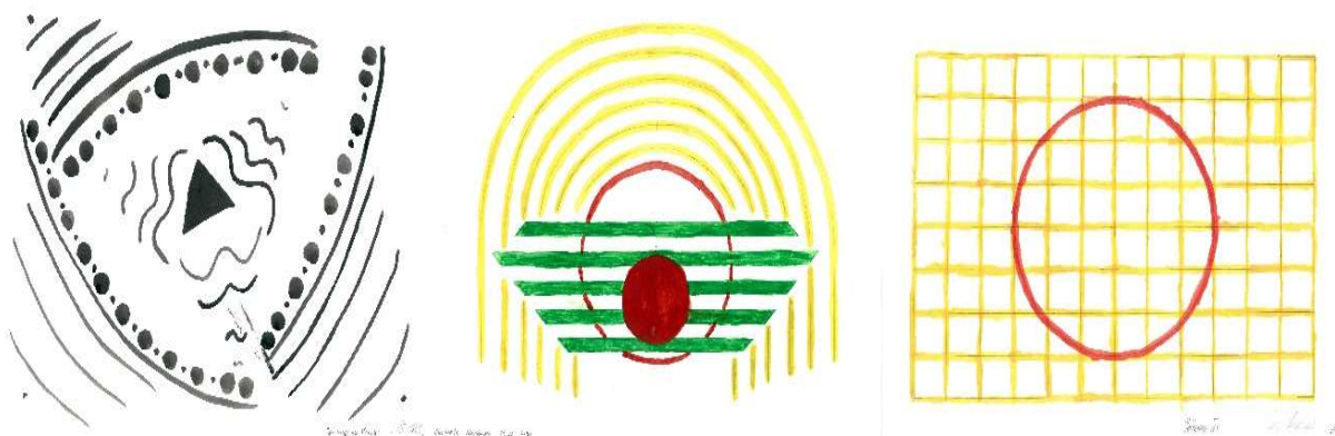
Рис. 1. Упражнение на тему «Композиция на плоскости»

помощью ритмических рядов»[6] имеет цель – овладеть первичными моторными навыками макетирования и изучить метро-ритмические закономерности.