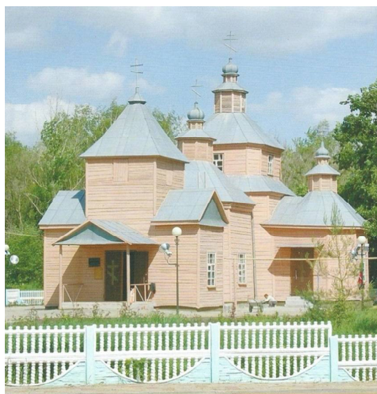
Рис. 5. Западный фасад