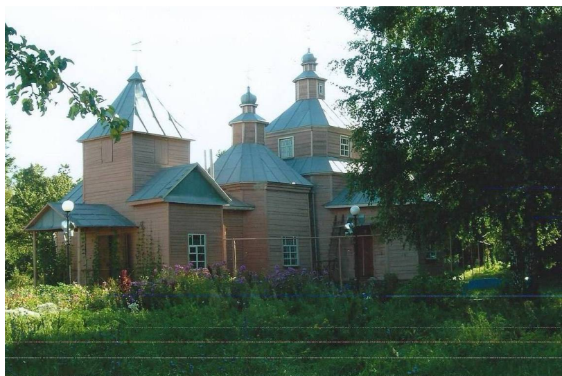
Рис. 4. Общий вид храма