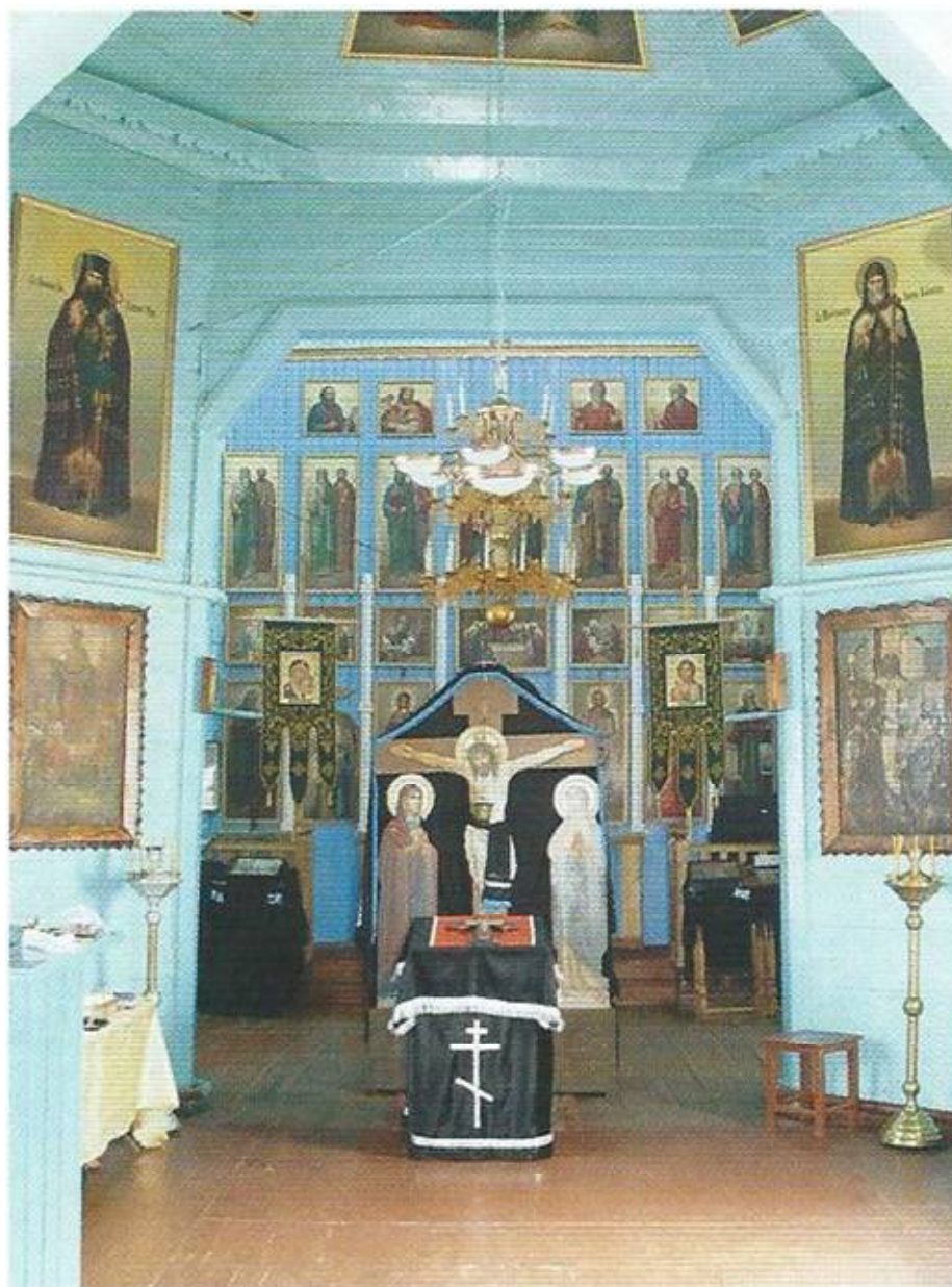
Рис. 3. Интерьер храма