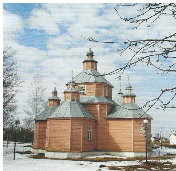
Рис. 6. Восточный фасад