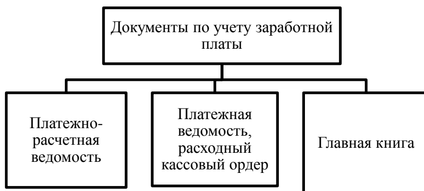
Рис. 2. Документы по учету заработной платы

Для синтетического учета заработной платы используют следующие документы: