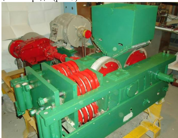
Рис. 1. Экспериментальная установка агрегата для получения кубовидного щебня

Устройство для направленной подачи сланцевых материалов состоит их приемного бункера, внутри которого, расположены две подвижные пластины 5 и валики 3, 4, которые служат для создания направленной подачи кусков сланцевой породы (рис.3).