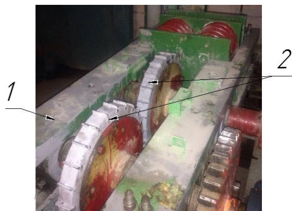
Рис. 2. Зубчатые валки ПВИ

Агрегат для получения кубовидного щебня работает следующим образом. Материал засыпается в приёмный бункер, где по подвижным пластинам подаётся к валикам, захватывается ими, поворачивается в вертикальное положение и направляется к зубчатым валкам, где раздавливается и выходит из межвалкового пространства в виде кусков, имеющих кубовидную форму с размерами, не превышающими шаг зубьев (рис. 4) [13].