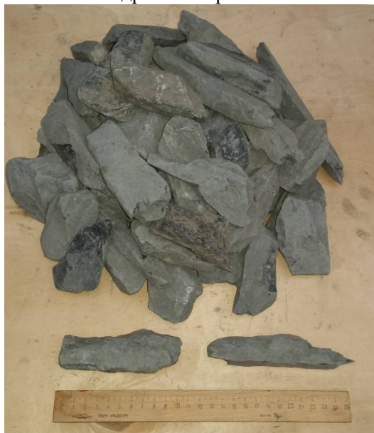
Рис. 4. Щебень до дробления на экспериментальной установке

ствие научно обоснованной методики расчета энергетических параметров агрегата во многом тормозит его внедрение в промышленность.