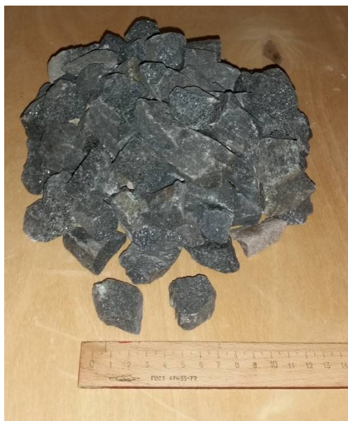
Рис. 5. Щебень после дробления на экспериментальной установке

Мощность привода агрегата для получения кубовидного щебня, затрачиваемая на выполнение вышеуказанных технологических операций, согласно [14], определяется по формуле: