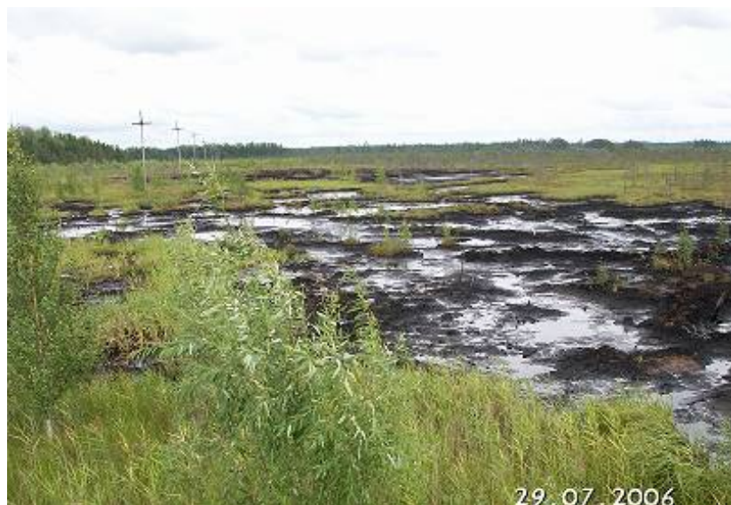
Рис. 1. Нефтезагрязненный участок, подлежащий рекультивации

Из множества способов определения координат поворотных точек участка применяется аналитический способ, основанный на использовании GPS-приемников. Максимально возможная точность определения координат в горизонтальной плоскости составляет 2-3 метра (при условии хорошей видимости небосвода) при применении «бытовых» GPS-приемников.