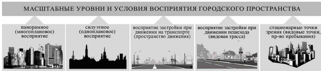
Рис. 4. Масштабные уровни и условия восприятия городского пространства. Сост. Заикина А.С.