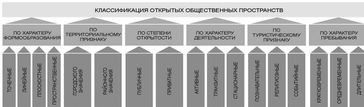
Рис. 1. Классификационные характеристики открытых общественных пространств. Сост. Заикина А.С.

тия), от способа передвижения и т.д. Пространство города характеризуется сложной комбинацией типов городской среды и социумов с различными средовыми ориентациями [9]. Общие рекреационные пространства вдоль градостроительной композиционной оси – малой реки в границах города всегда имеют большое значение для качества среды жизнедеятельности [10].