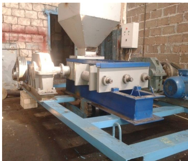
Рис. 1. Пресс-валковый измельчитель с устройством для дезагломерации материалов: а) схема, б) опытная установка

Агрегат для измельчения материалов работает следующим образом. В загрузочный бункер 2 подается исходный материал, например, клинкер который захватывается коническими валками, между которыми осуществляется его разрушение и прессование.