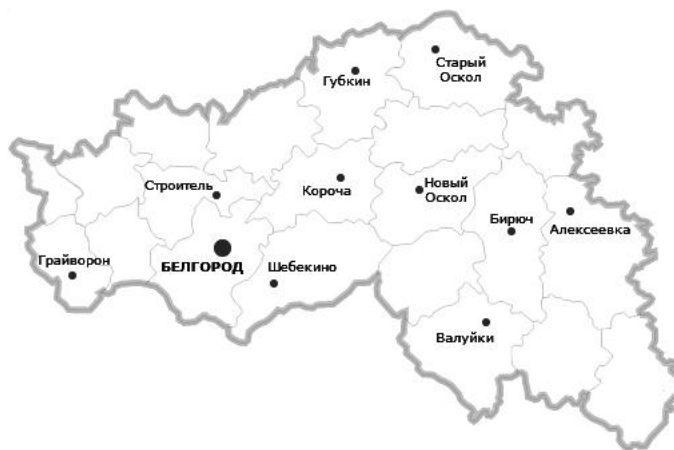
Рис. 1. Расположение малых городов Белгородской области, сост. А.В. Рашенко

Под влиянием промышленного освоения региона исторически сложилась структура городских поселений, преимущественно состоявшая из малых городов численностью до 50 тыс. человек. Как и в других малых городах Центрального Черноземья, в городах Белгородской области в последнее время было незначительное падение показателей рождаемости и естественного прироста (рис. 2), однако резкого снижения