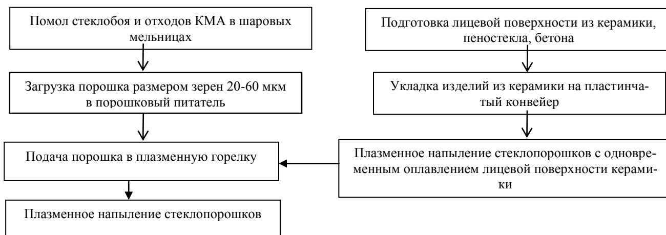
Рис. 2. Технологическая схема глазурования изделий из керамики, блочного пеностекла и легкого бетона

** Кроме того, в сортовом зеленом стекле содержалось 2,0% MgO, в отходах 4,97%MgO