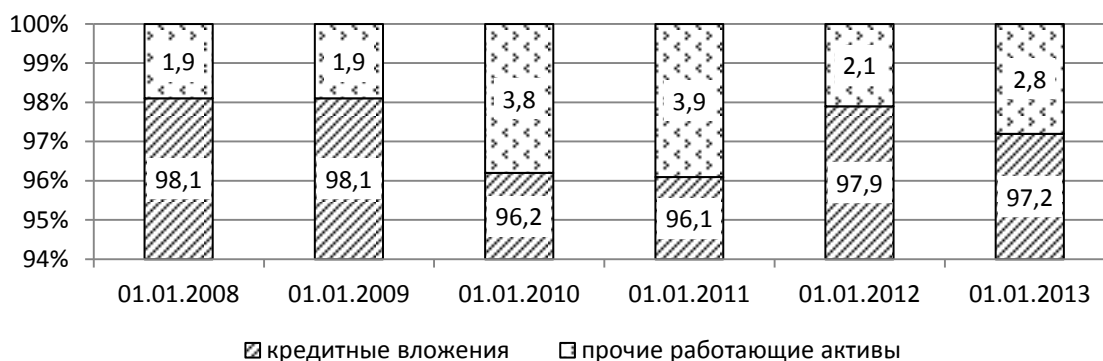
Рис. 1. Структура работающих активов банковского сектора Липецкой области в 2008-2012 гг., %

Кредитные операции являются основными активными операциями российских банков, не являются исключением и кредитные организации Липецкой области, где кредитные вложения составляют значительную долю работающих активов банковского сектора (рис. 1) [1].