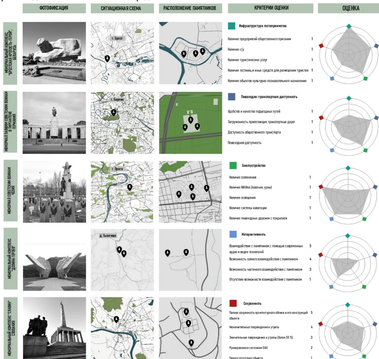
Рис.1. Сравнительный анализ основных характеристик мемориальных комплексов. Зарубежный опыт. Разраб. Рябчевская П.В., Перькова М.В., Ладик Е.И.

близости от памятника. Возможно использование общественного транспорта, такого как автобусы или трамваи, чтобы добраться к началу пешеходного маршрута.