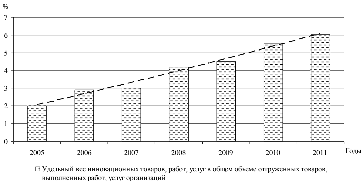
Рис. 5. Удельный вес инновационных товаров, работ, услуг в общем объеме отгруженных товаров, выполненных работ, услуг организаций в Республике Башкортостан в 2005 – 2011 гг., %

объема отгруженных товаров, выполненных работ, услуг организаций, то можно отметить, что в 2005 – 2011 гг. наблюдался неуклонный рост удельного веса инновационных товаров, работ и услуг (рисунок 5).