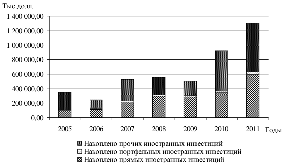
Рис. 2. Структура накопленных иностранных инвестиций в Республике Башкортостан в 2005 – 2011 гг., тыс.долл.

потенциала из-за рубежа, показатели, характеризующие ввоз инвестиционного потенциала из других регионов Российской Федерации (включая средства федерального бюджета), и показатели, характеризующие наращение инвестиционного потенциала за счет средств внешних по отношению к региону кредитных организаций и другие.