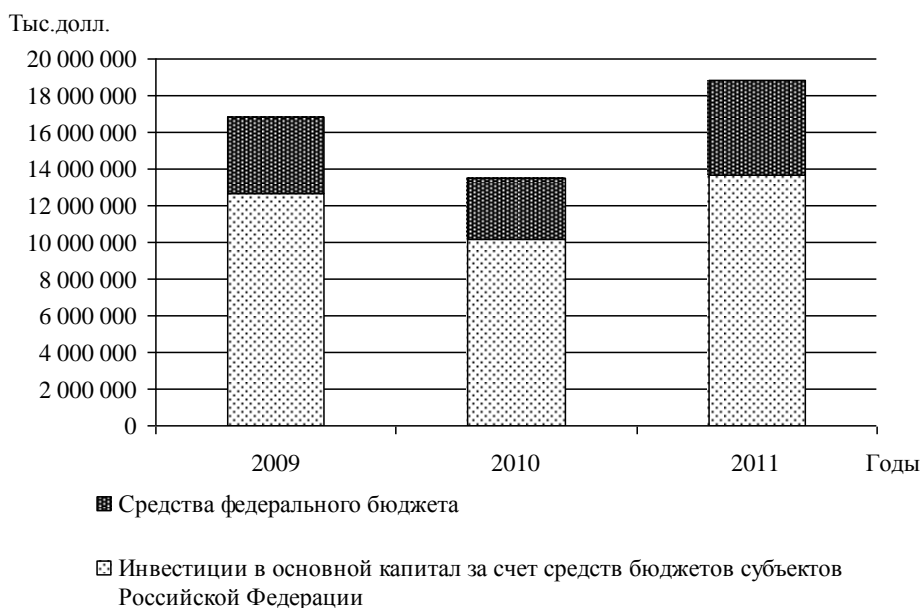
Рис. 3. Структура инвестиций, поступающих в экономику Республики Башкортостан из федерального бюджета и бюджетов субъектов Российской Федерации в 2009 – 2011 гг., тыс.долл.

Инвестиции в экономику региона поступают не только из зарубежных стран, но и из федерального бюджета и из бюджетов субъектов Российской Федерации, причем величина инвестиций, поступающих из других регионов России, в значительной степени превышает величину инвестиций из федерального бюджета (рисунок 3).