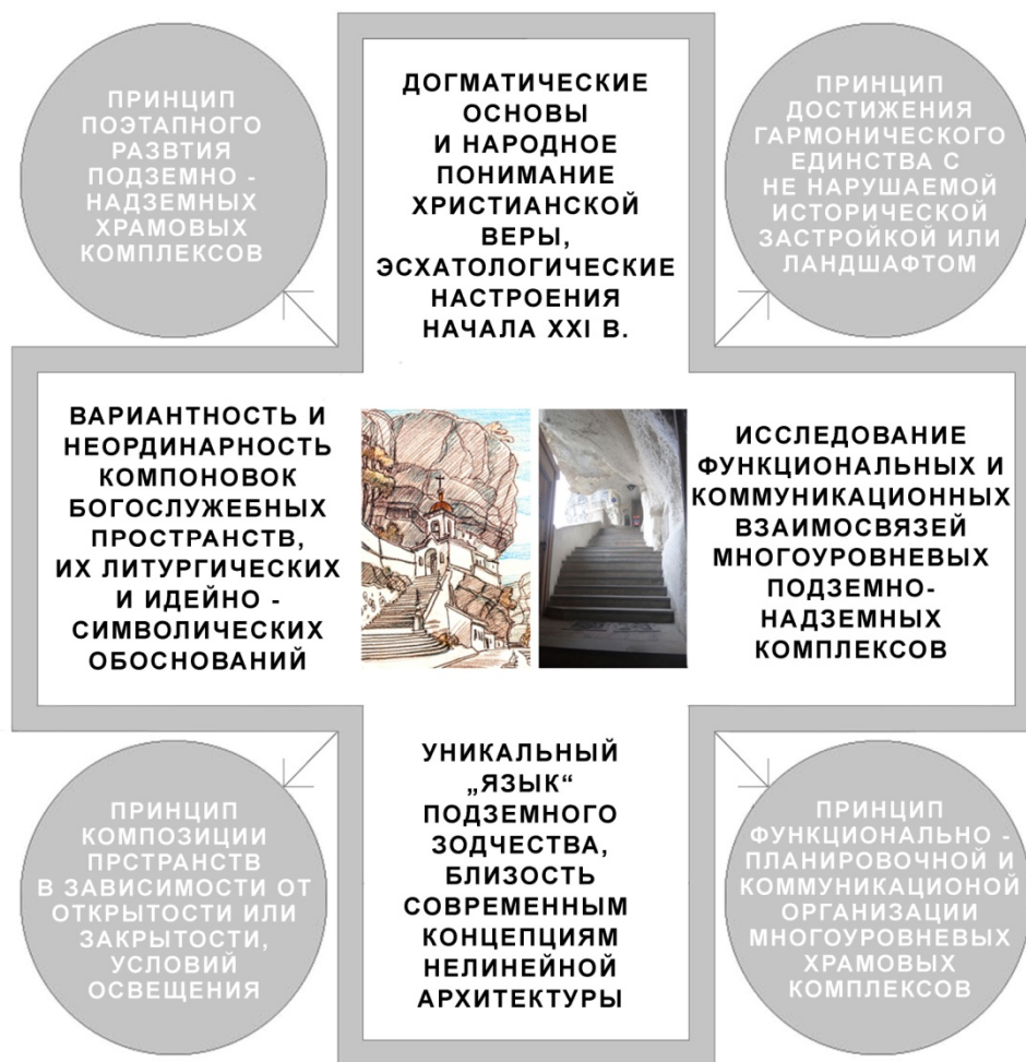
Рис. 1. Позиции актуальности (на рисунке в ветвях креста) и принципы современного проектирования, предполагаемые к разработке (на рисунке в окружностях). В центре – Бахчисарайский Успенский монастырь, Крым (рис. и фото Борисова С.В.)

щиеся к «народному» Православию оригинальные, немного наивные идейно-символические обоснования подземной храмовой и монастырской архитектуры. Изучение указанной архитектуры в связи с изменениями богословия и богослужбной практики составит основу методики проектирования, позволяющей непредвзятое рассмотрение устоявшихся композиционных решений храмовых объектов, принимаемых в настоящее время в качестве единственно возможных (рис. 1).