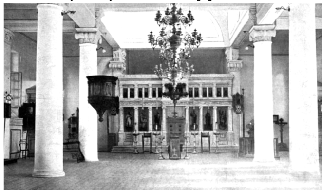
Рис. 1. Благовещенская греческая церковь в Ростове-на-Дону.

Архит. Г. Н. Васильев, 1907–1909 гг. [6, 8]