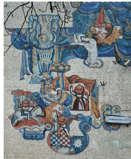
Рис. 3. Театр кукол в Ростове-на-Дону. Архит. Л. Адамкович и Е. Потапов, 1968 г. Фотография 2020 года. Мозаичное панно. Худ. Г Снесарев, В. Коробов

«Старое» и «новое» в архитектуре Ростовского театра кукол. Период становления советского модернизма – эпоха «оттепели» - в столичной и региональных архитектурных школах характеризуется общими тенденциями в формировании нового архитектурного облика зданий, отрицающего исторические аналогии.