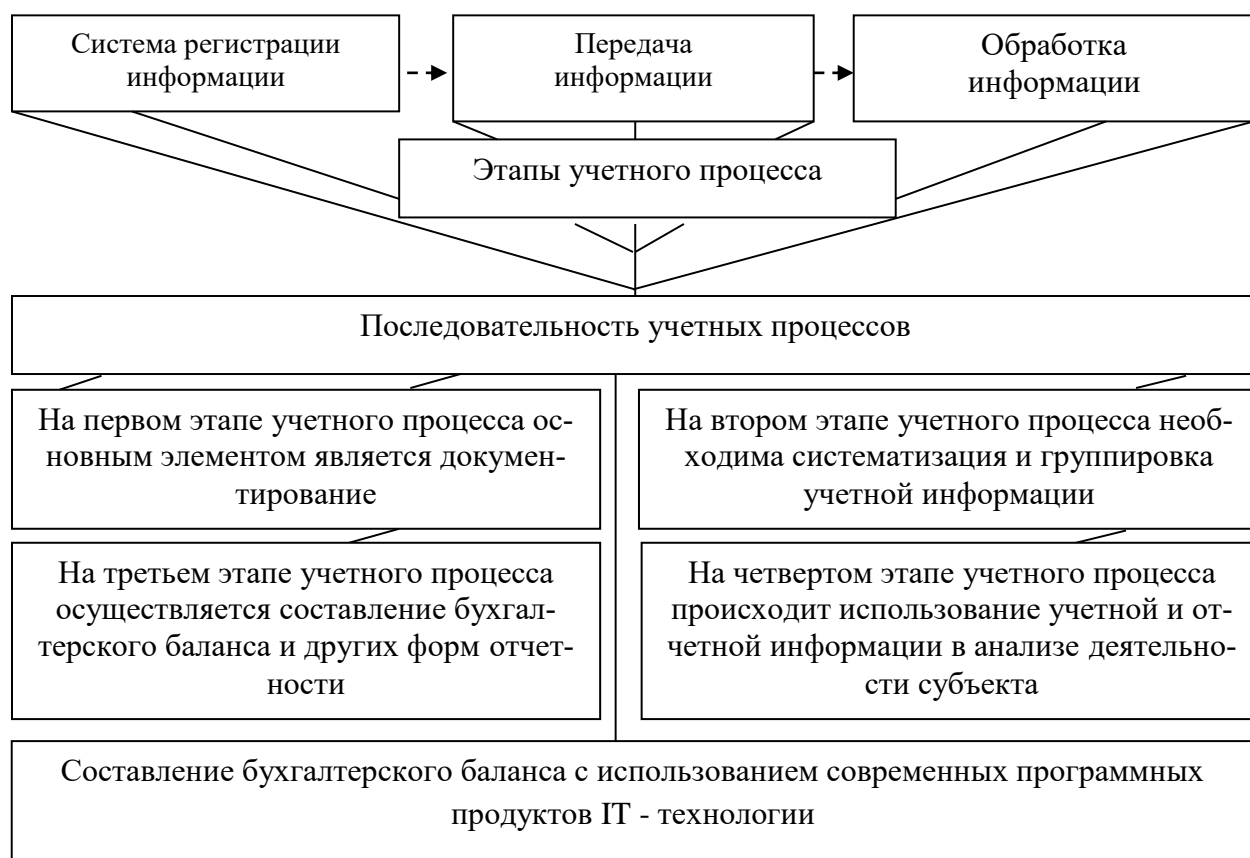
Рис. 1 Этапы учетно-аналитического процесса

Третий этап учетного процесса позволяет систематизировать информацию в оборотно-сальдовую ведомость для дальнейшего составления бухгалтерского баланса.