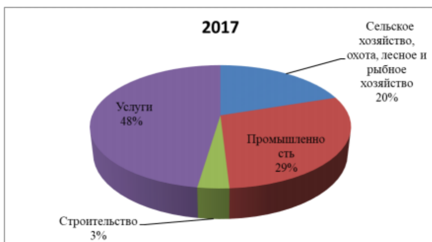
Рис. 3. Структура экономики Сирии по отраслям в 2017 г., % от ВВП

В то же время доли основных секторов национальной экономики Сирии в общем объеме ВВП практически не изменились (рис. 2). Государственный бюджет Сирии на протяжении рассматриваемого периода верстается со значительным, хотя и не растущим, дефицитом, так как доходы бюджета от нефти и налогов значительно сократились. Государственный бюджет столкнулся с резким ростом бюджетного дефицита, поскольку текущие расходы растут. В результате общий государственный долг увеличился, и главным инструментом финансирования национальной экономики стал внутренний долг. Лишь с 2017 г. наметился рост ВВП, причем таким образом, что в 2018 г. его объем по стоимости не достиг даже уровня 2000 г. [7].