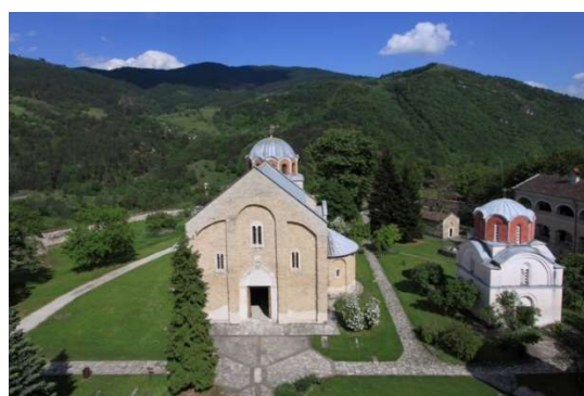
Рис. 5. Монастырь Студеница. Сербия