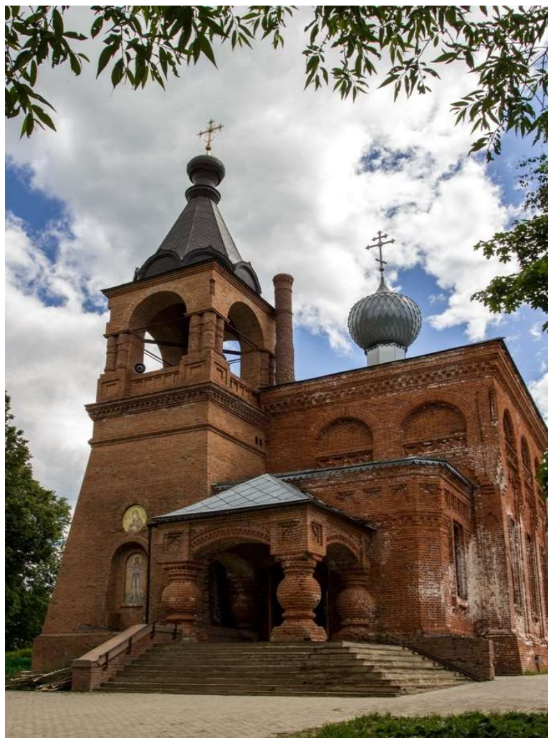
Рис.2 Храм святого преподобного Алексея, человека Божия