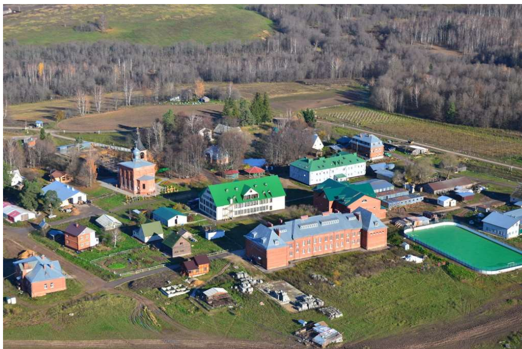
Рис.1 Свято-Алексиевская Пустынь