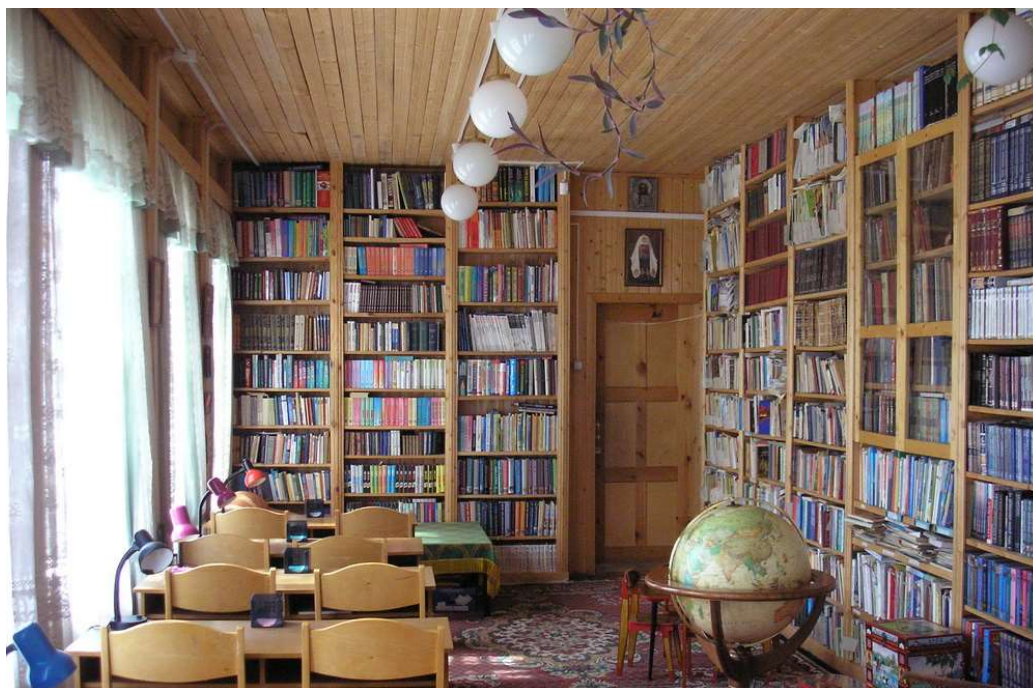
Рис.3. Библиотека кадетского корпуса

Включение в монастырский ансамбль зданий библиотек, духовно-просветительских школ и других объектов, играющих в настоящее время важную роль в духовно-нравственном возрождении общества, является по существу древней традицией [14]. Можно привести некоторые примеры архитектурного решения монастырских комплексов Сербии, включающих объекты социально и иного значения.