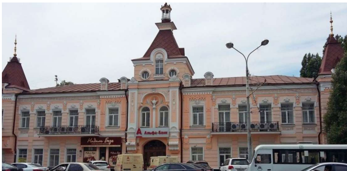
Рис. 2. Доходный дом Шендерова, арх. Н.М. Соколов, г. Ростов-на-Дону. Фото Петрусенко Ю.В., 2018 г.

Архитектурно-художественная пластика главного фасада, обращенного на восток, представлена выступающей центральной частью и боковыми ризалитами, которые, на уровне второго этажа, переходят в прямоугольные эркеры. Центральный ризалит на уровне первого этажа выделен высоким проемом с арочным сводом. Два арочных окна, второго этажа, полуциркулярной формы объединены высокой полуколонной стилизованного коринфского ордера. Фриз северной и южной части фасада оформлен раппортом лепного растительного орнамента. Северная и южная часть фасада, представленная эркерами, сформирована профилированными наличниками слуховых окон шатровых крыш, подкарнизная