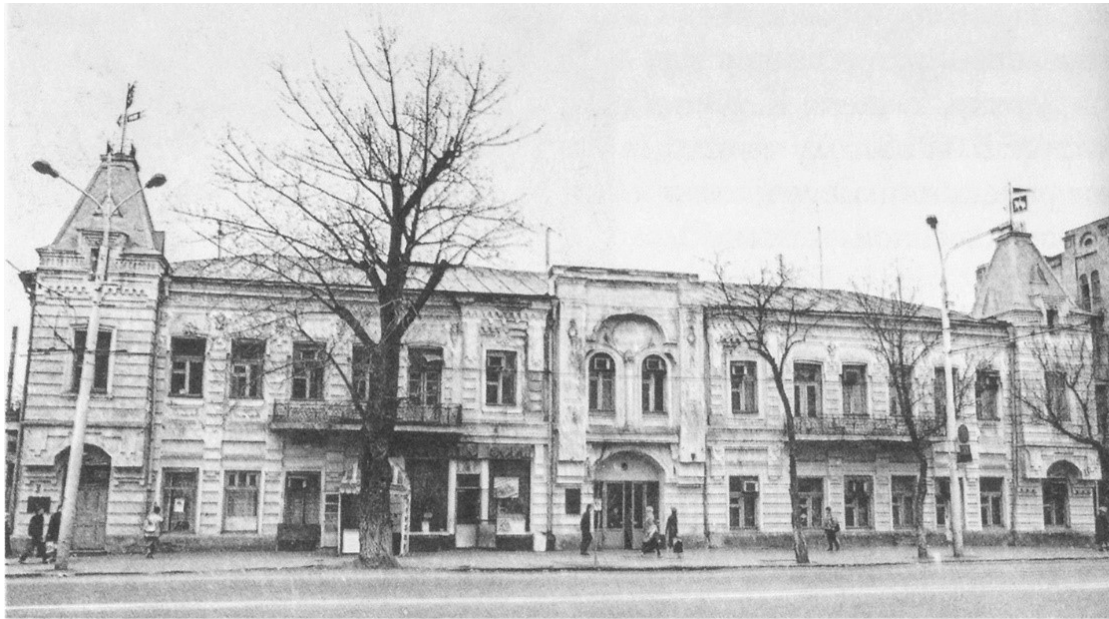
Рис. 1. Доходный дом Шендерова, арх. Н.М. Соколов, г. Ростов-на-Дону [4]

ванного растительного орнамента и др. Семейный дом имел выгодное местоположение в системе застройки квартала [4].