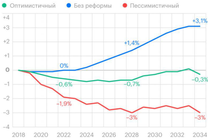
Рис.2. Эффект от повышения пенсионного возраста на реальные доходы на душу населения [6]

Оптимистичный сценарий рассматривает то, что мужчины и женщины, работающие после 50 и 55 лет, будут получать заработную плату, как и работающие сейчас пожилые люди, т.е. около 31-32 тыс. рублей, но при этом пенсия будет индексироваться выше, чем уровень инфляции. Прогнозируемый эффект на реальные доходы составит минус 0,3% (рис.2).