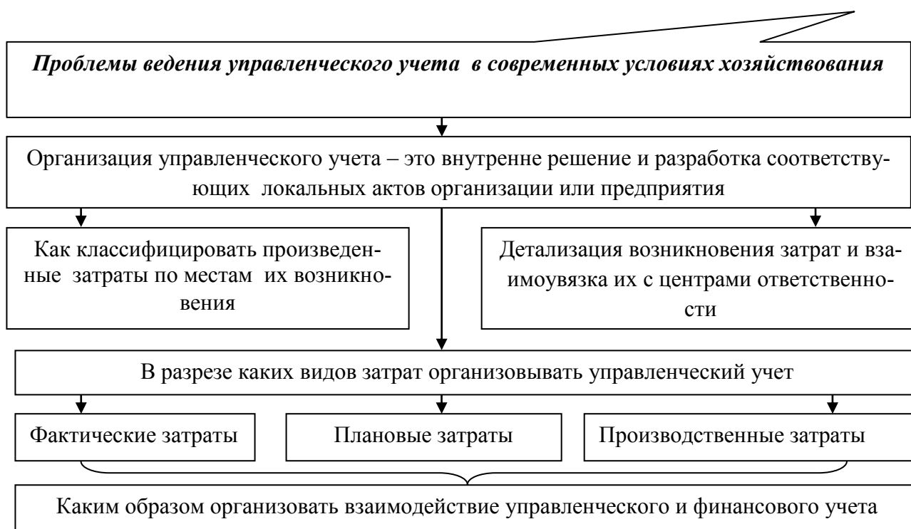
Рис. 3. Проблемы организации управленческого учета

На рис. 3 рассмотрены существующие проблемы и особенности развития управленческого учета, которые остаются актуальными вопросами в настоящее время.