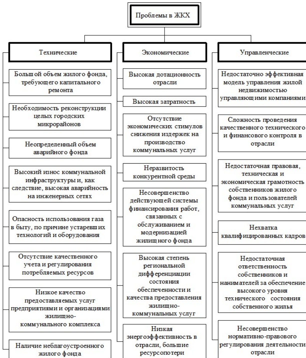
Рис. 1. Основные проблемы ЖКХ

По этой причине на разных уровнях управления необходимо исследовать и ранжировать факторы по степени их взаимовлияния на систему, а также своевременно осуществлять регулирование управляемых параметров для достижения их оптимального сочетания.