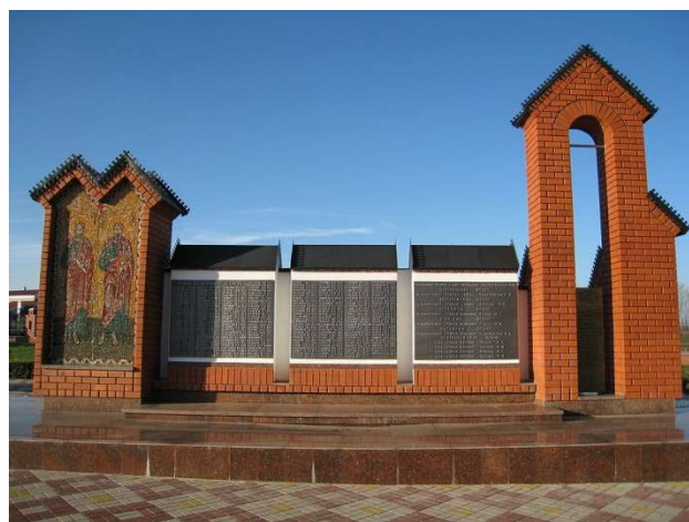
Рис. 7. Памятная стена