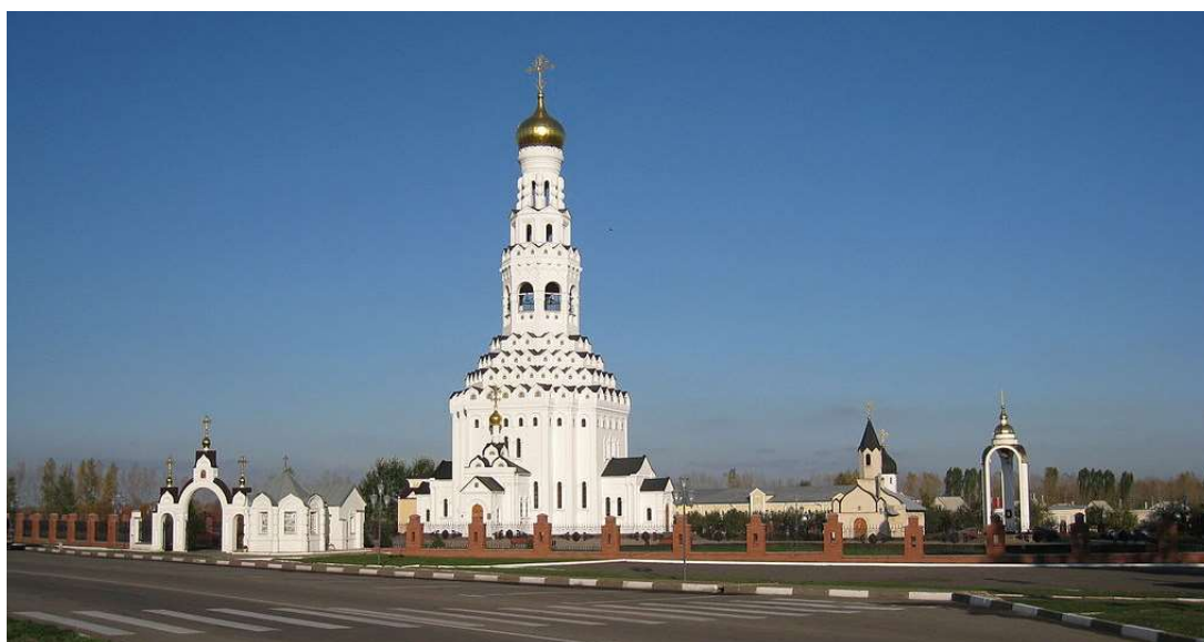
Рис. 1. Общий вид на храмовый комплекс

треугольными фронтончиками, третий ярус, завершающий вертикальную композицию, украшен в простенках бусами и многопрофильными фризом и карнизом барабана, над которым возвышается луковичная глава. Пространственно-планировочная структура здания представляет собой симметричный крестообразный план, в центре которого расположен четверик храма, все стороны которого обстроены равными по площади приделами, притворами алтарем. Приделы и алтарь сообщаются с храмом через арочные проемы. В храме устроены три входа, как указано на Святую Троицу: с западной стороны (это главный вход), с северной и южной сторон. Четверик храм перекрыт сомкнутым сводом, за которым скрыта галерея, ведущая на колокольню.