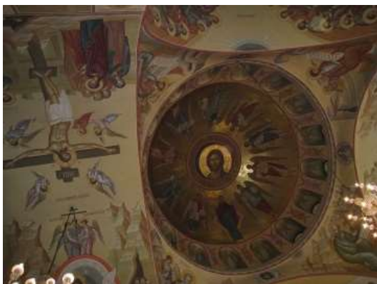
Рис. 4. Роспись купола храма

В храме установлен трехъярусный резной, позолоченный иконостас. Третий ярус представлен тремя иконами, обрамленными крупными арками, центральная икона, завершающая композиционную ось царских врат, выше и крупнее боковых икон. Форма царских врат имитирует воинский орден, в котором от иконы «Благовещение» расходятся золотые лучи плотным фоном, на котором по четырем углам расположены иконы евангелистов, как обрамление из драгоценных камней.