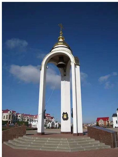
Рис. 6. «Колокол Единения»

Белгородского и Старооскольского Иоанна и губернатора Белгородской области Е.С. Савченко. На каждом пилоне ротонды изображения святых, которые особо почитаются тремя славянскими народами: образ святого равноапостольного великого князя Владимира, Преподобного Сергия Радонежского и преподобной Евфросинии Полоцкой [2]. Сам колокол был отлит в Москве, а по его верхнему поясу начертаны слова Преподобного Сергия Радонежского: «Любовию и единением спасемся». 3 мая 2000 года после Божественной литургии в храме Святых первоверховных апостолов Петра и Павла «Колокол Единения» славянских народов освятил Святейший Патриарх Московский и всея Руси Алексий II в присутствии президентов России, Украины и Белоруссии: В.В. Путина, Л.Д. Кучмы и А.Г. Лукашенко.