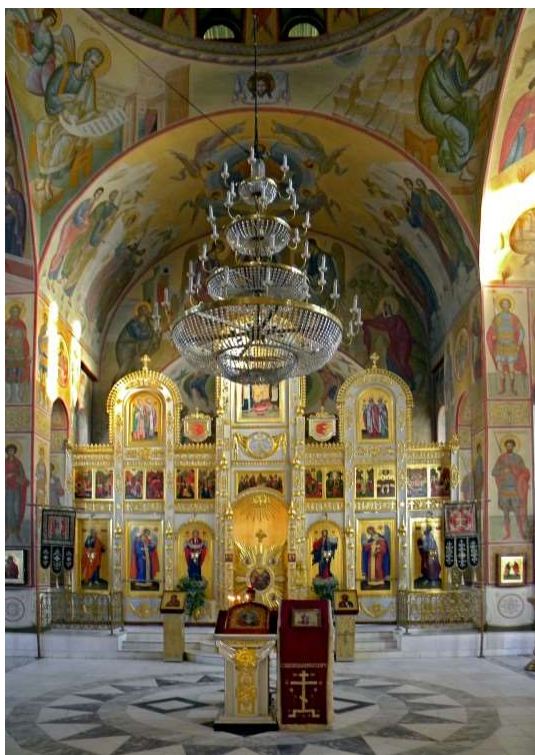
Рис. 5. Храмовый иконостас

«Колокол Единения», расположенный в южной части храмового комплекса, недалеко от храма во имя святых апостолов Петра и Павла, представляет собой ротонду на трех пилонах-опорах, перекрытую сводом, в центре которого висит колокол. Ротонда была возведена по инициативе митрополита (в то время архиепископа)