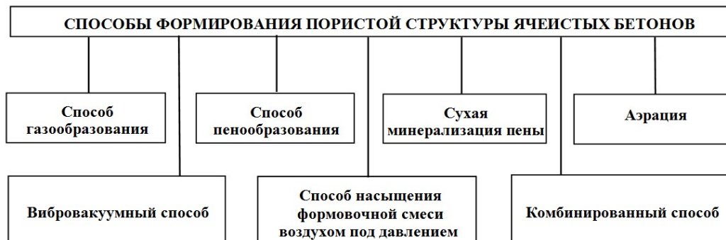
Рис. 2. Способы формирования пористой структуры ячеистых бетонов

Для создания высокопористой структуры ячеистых бетонов применяются следующие способы: газообразования, пенообразования, аэрации и сухой минерализации пены, вибровакuumный, способ насыщения формовочной массы воздухом под давлением, комбинированные способы (рис. 2).