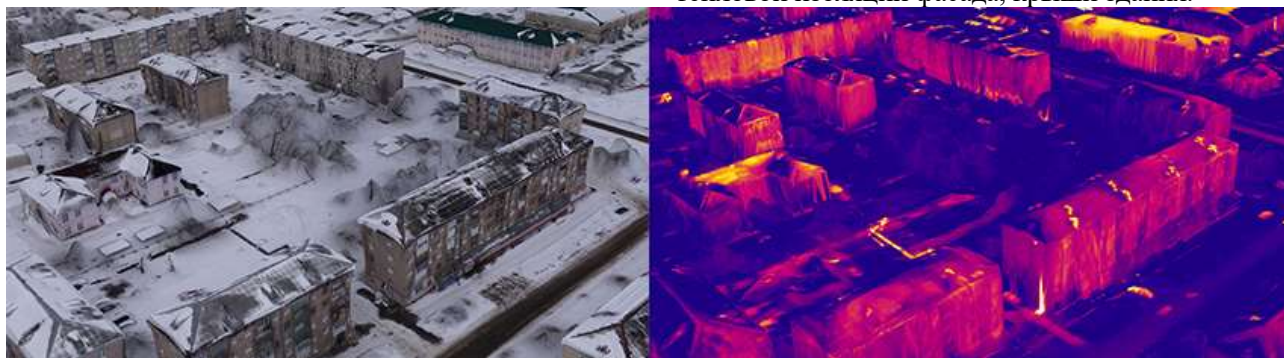
Рис. 2. Тепловизионная съемка с применением БПЛА

– отслеживания степени и скорости изменения технического состояния объекта и принятия в случае необходимости экстренных мер по предотвращению его обрушения.