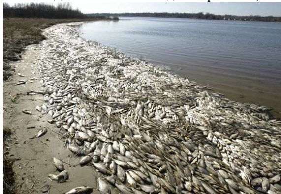
а) загрязнение морского побережья

Согласно последнему докладу Министерства промышленности и торговли Вьетнама [14] в настоящее время в стране работают более 20 угольных электростанций, дающих более 15,7 млн. т./год топливных отходов. При этом, в за-