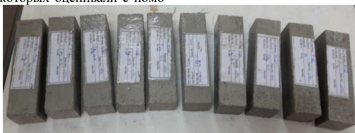
Рис. 4. Экспериментальные образцы из цементно-песчаных растворов

Экспериментальные образцы изготавливали из цементно-песчано-зольных растворов при соотношениях Ц : П = 1 : 3, В/Ц = 0,5 и ЗО/Ц = 0 ÷ 0,5 в соответствии с требованиями стандарта ГОСТ 30744 - 2001 [18]. Из каждого растворного состава формовали по 3 балочки размером 40×40×160 мм (рис. 4), которые после твердения в нормальных условиях испытывали на изгиб, а затем их половинки – на сжатие (рис. 5). Полученные результаты испытаний использовали для расчёта индексов активности по прочности на сжатие (табл. 4 и рис. 6).