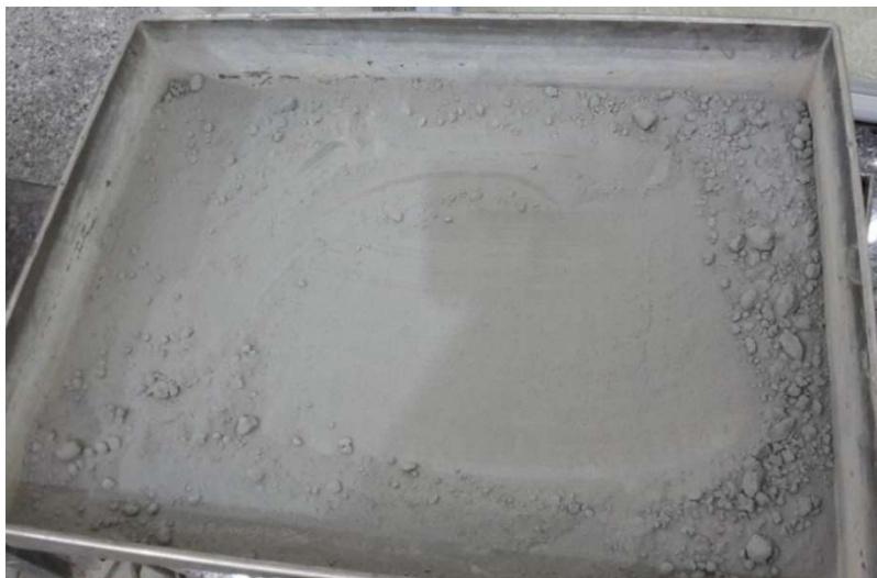
Рис. 3. Зольные остатки ТЭС Вунг Анг (Вьетнам)

ной добавки в бетонные и растворные смеси, приведены в табл. 1 и 2.