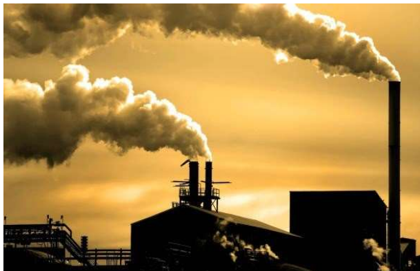
б) загрязнение воздуха

висимости от типа используемого угля и технологии его сжигания при получении 1 МВт электрической энергии образуется от 1200 до 1800 т. золы и шлака.