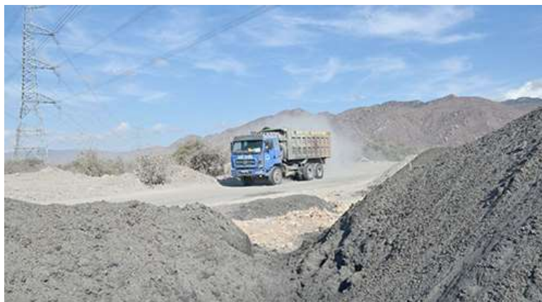
Рис. 2. «Шторм», вызванный складированием топливных отходов ТЭС Вунг Анг на открытых площадях

Согласно результатам исследования [15] организация и проведение мероприятий по утилизации промышленных отходов позволяют решить следующие актуальные вопросы: