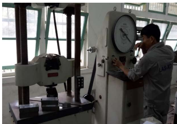
Рис. 5. Определение прочности образцов на сжатие