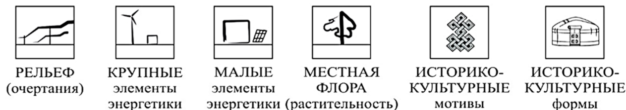
Рис. 1. Элементы композиционного облика современного туристического комплекса.

Композиционно-эстетическое решение должно формироваться комплексно с обязательным использованием нескольких элементов (рис.1) композиционного облика.