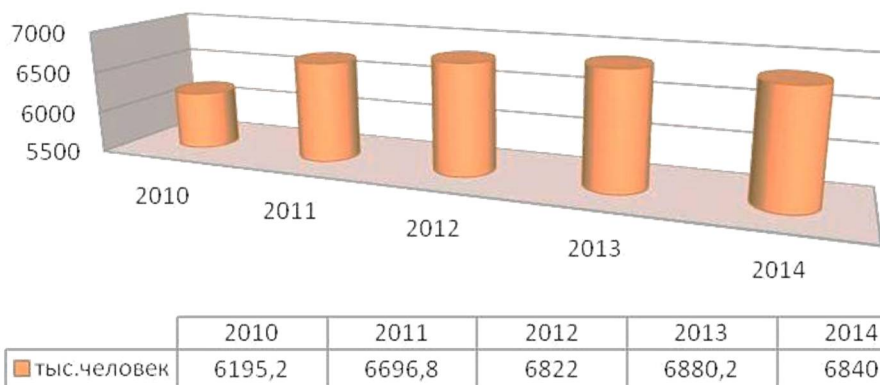
Рис. 2. Общая численность работников малых промышленных предприятий в России за 2010–2014 годы

к увеличению до 2013 года, немного снижаясь в 2014 году до уровня 6840,0 тыс. чел. (рис. 2).