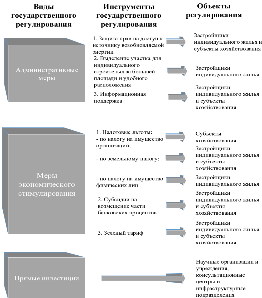
Рис. 2. Предлагаемые инструменты региональной инвестиционной стратегии в сфере развития альтернативной энергетики

На рисунке 2 представлена схема всех мероприятий, предусмотренных нами в структуре инвестиционной стратегии в сфере альтернативной энергетики на территории Белгородской области.