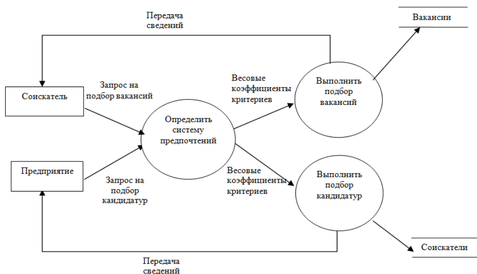
Рис. 1. Модель потоков данных работы системы с использованием системы предпочтений

лем с помощью функций принадлежности, приводится в табл. 1.