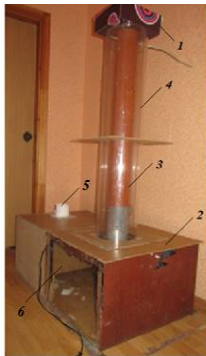
Рис. 2 Фото экспериментальной установки: 1 – верхний короб, 2 – нижний короб, 3 – загрузочная труба, 4 – цилиндрическая байпасная камера, 5 – вытяжной патрубок, 6 – вертикальная перегородка

Для определения эффективности работы совместного использования перфорации загрузочной трубы и байпасной камеры проводилось измерение скорости воздуха, удаляемого из нижнего короба через вытяжной патрубок. Если скорость удаляемого воздуха при наличии байпасной камеры, а также при нанесении перфорации на загрузочную трубу будет уменьшаться, то расход воздуха, удаляемого из аспирируемой камеры нижнего короба, будет также снижаться. На практике это позволит сделать систему аспирации более энергоэффективной, т.к. количество удаляемого из укрытия воздуха на прямую связано с затратами электроэнергии необходимой для работы вытяжного вентилятора. Выбранный диаметр байпасной камеры, согласно проведенным исследованиям [14], по отношению к диаметру загрузочной трубы является оптимальным для эффективного байпасирования.