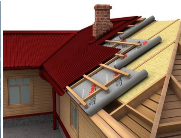
Рис. 1. Применение диффузионных мембран

Современный рынок строительных материалов предоставляет широкий выбор диффузионных мембран, однако, по результатам исследования, лучшие показатели паропроницаемости, водонепроницаемости и разрывной нагрузки