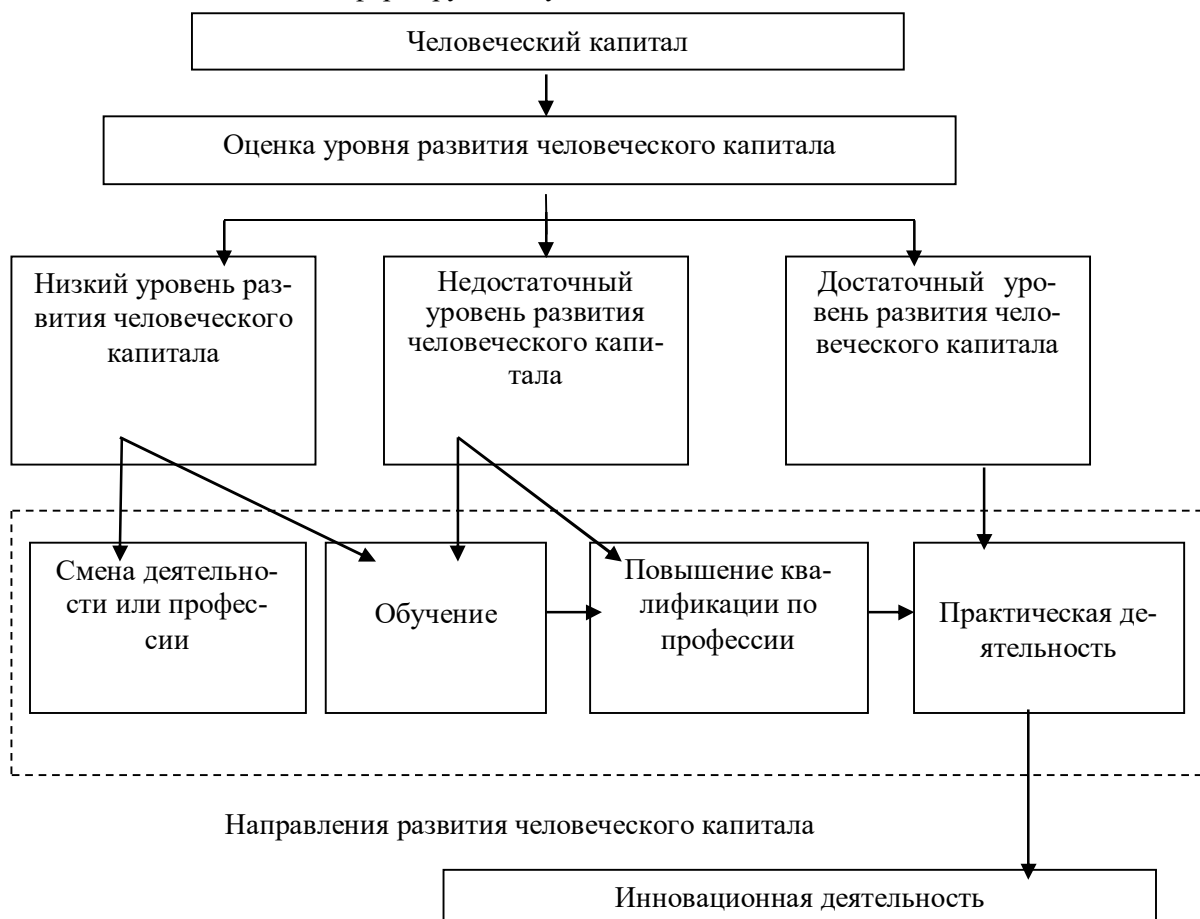
Рис. 2. Направления развития человеческого капитала машиностроительного предприятия в целях развития инновационной деятельности

Направления развития человеческого капитала машиностроительного предприятия в целях развития инновационной деятельности представлены на рис. 2.