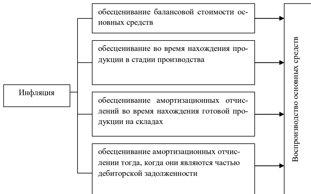
Рис.3. Механизм влияния инфляции на воспроизводство основных средств