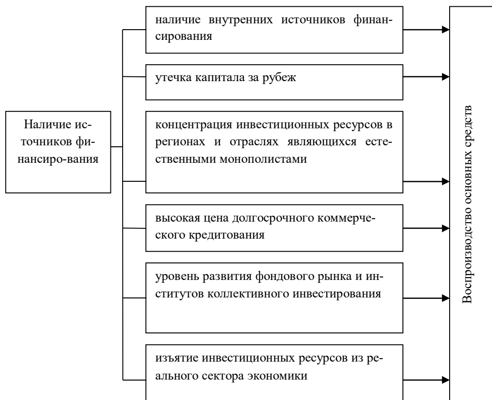
Рис.4. Механизм влияния наличия источников финансирования на воспроизводство основных средств

4. Низкая цена живого труда на рынке труда препятствует производительному применению новейших технологий, препятствует динамике основного капитала. Этот фактор также является