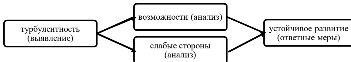
Рис. 2. От турбулентности к успешному развитию

виям экономической турбулентности. В нынешних условиях основной тон задают турбулентность, хаос, риск и неопределенность. Все это и образует «новую реальность», в условиях которой особенно сложно приходится предприятиям малого и среднего бизнеса.