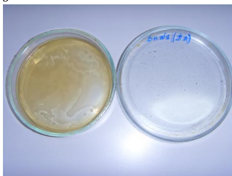
Рис. 3. Чашки Петри с колониями бактерий, выросшими на питательной среде:

a – образцы из полипропилена находились на юго-западе г. Саранска; б – образцы из полипропилена находились в Лямбирском районе