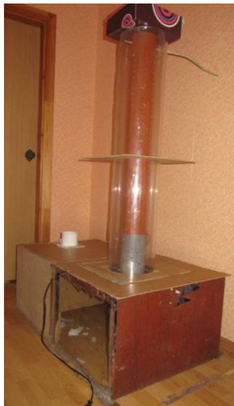
Рис. 2 Фото экспериментальной установки

от друга расстоянии по всей длине трубы в количестве 35 шт. (7 рядов по 5 шт.). В первом случае верхняя и нижняя часть байпасной камеры полностью перекрывалась, а во втором – перекрывалась лишь нижняя часть байпасной камеры. Установка (рис. 2а, 2б) включалась, а затем производилось задымление полости байпасной камеры через отверстие в наружной стенке байпаса. Нанесение перфорации в зоне разряжения при данном условии работы установки (при перекрывании байпасной камеры) не имеет смысла, т.к. в полости байпасной камеры в этом случае будет область разряжения и воздух двигаться в ней не будет из-за отсутствия торцевого перетекания.