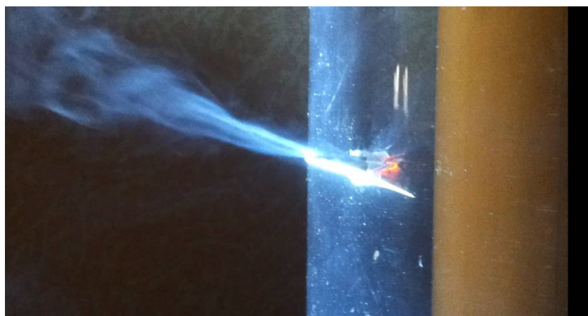
Рис. 3. Задымление установки при полном перекрытии байпасной камеры