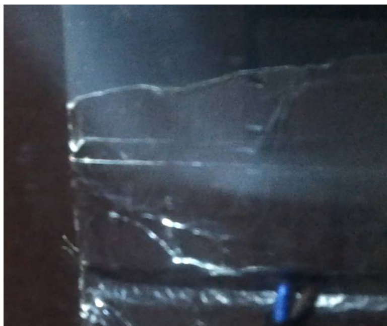
Рис. 4. Задымление установки при перекрытии байпасной камеры в нижней части