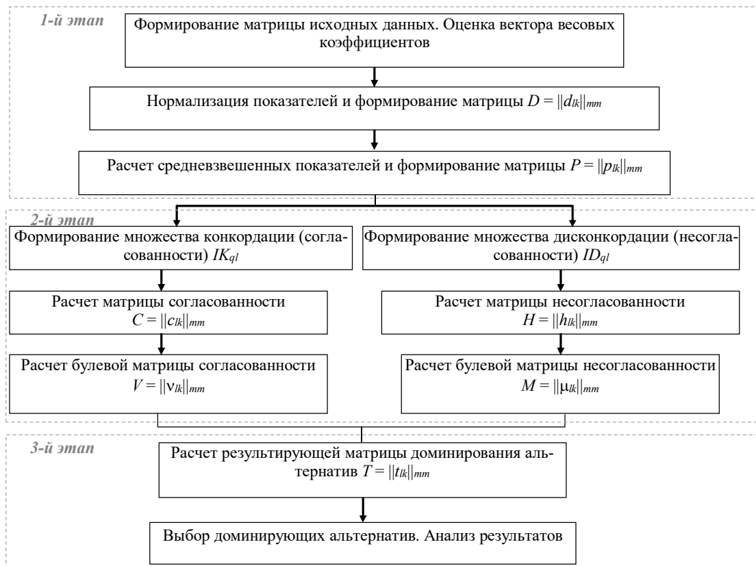
Рис. 1. Общая схема метода ELECTRE

Рассмотрим реализацию метода ELECTRE на примере выбора поставщика строительной организации. В ходе анализа была сформирована группа основных критериев и выбраны пять поставщиков для организации. По результатам исследования составлена таблица 3.