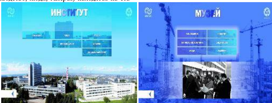
Рис. 3. Пример макетов реализуемой системы в НИИИС им. Ю.Е. Седакова

дии подбора и наполнения информационным контентом. Примеры макетов представлены на рис.3.